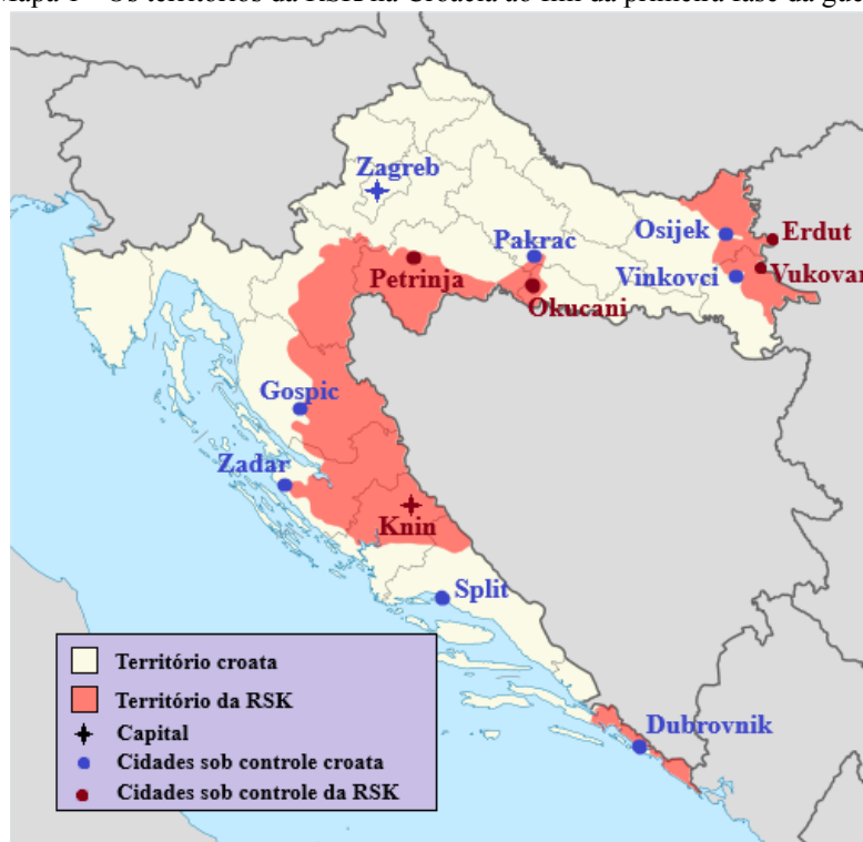
Mapa 1 - Os territórios da RSK na Croácia ao fim da primeira fase da guerra

Fonte: elaborado pelo autor com base em CIA (2003) e Tomobe03 (2013) .