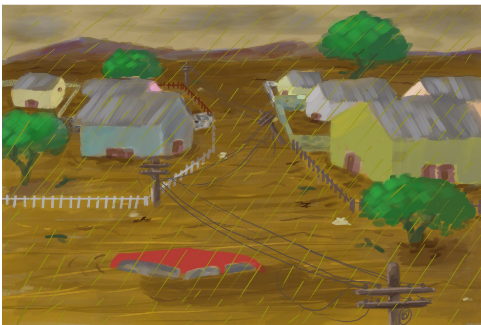
“Enchente”, 2024. Jéssica Michelin.

Passaram-se os dias e as pessoas foram resgatadas, enquanto ajudamos uns aos outros, vemos o nosso bairro com a água até as janelas, esperando que tudo isso passe logo para podermos recomeçar.