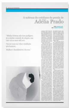
Clique sobre a imagem para acessar a versão on-line

Leia a reportagem completa publicada no JU impresso especial de maio de 2019 que trazia as Leituras Obrigatórias para o Vestibular. A matéria era acompanhada de uma obra da artista Gabriella Gasperim.