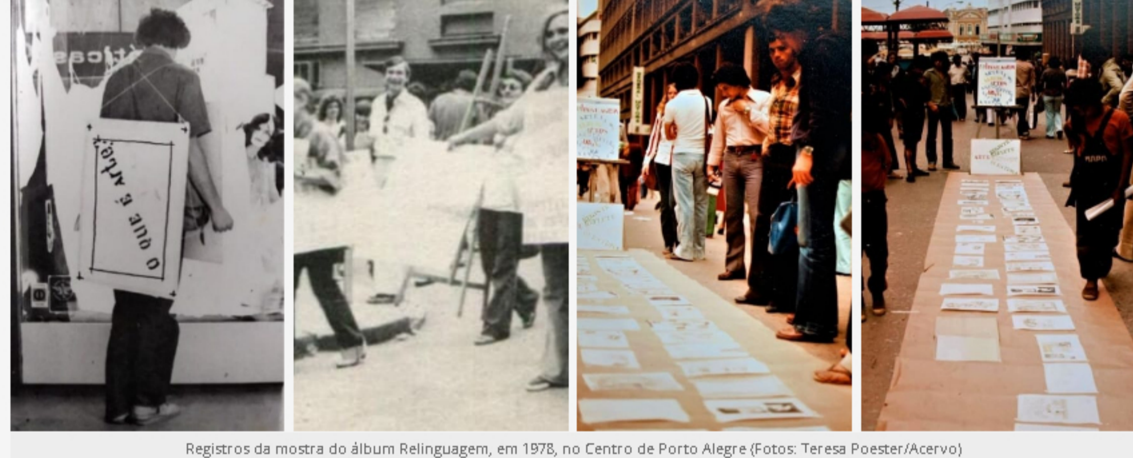
Registros da mostra do álbum Relinguagem, em 1978, no Centro de Porto Alegre

De acordo com Carolina, “com o desejo de experimentar novas alternativas de manifestação artística e de intercambiar ideias com artistas de outras localidades”, por meio de uma intervenção na Esquina Democrática, Rua dos Andradas, o grupo lançou o álbum Relinguagens I , rico em arte postal. Uma das principais características dessa arte é a colaboração, permitindo a fusão de ideias e de estilos, razão pela qual os artistas acabaram se aproximando desse formato.