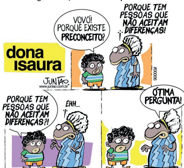
Figura 5 – Quadrinho sobre preconceito.

Fonte: Junião – cartunista e ilustrador, 2014 7 .