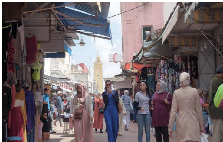
Figura 1 – Rabat, Marrocos/África.

Em um segundo momento, mostramos imagens de algumas cidades do continente africano e, sem que eles soubessem que são países na África, questionamos: Onde vocês acham que fica essa cidade? A primeira imagem que mostramos foi do Marrocos (Figura 1), e que eles identificaram como sendo a Índia, Nigéria, Argélia, China.