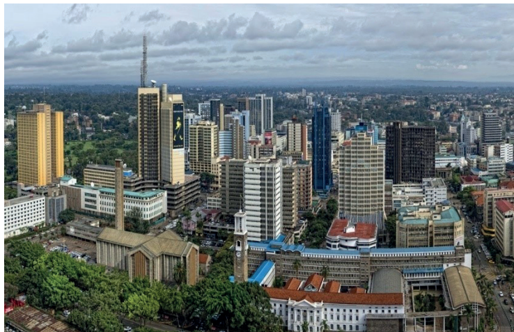
Figura 2 – Nairóbi, Quênia/África.