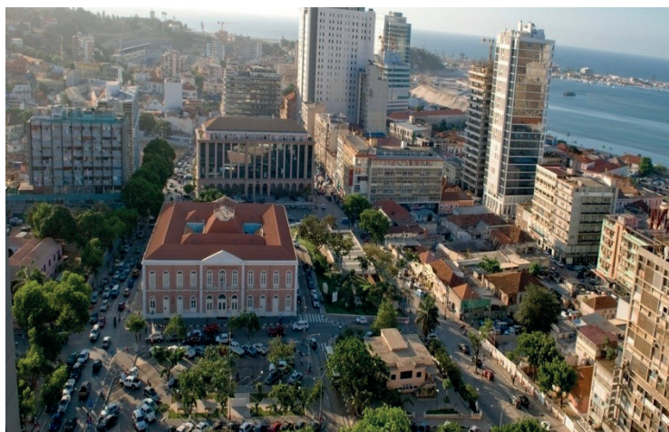
Figura 3 – Luanda, Angola/África.

Por último Angola (Figura 3) que eles identificaram como Brasil.