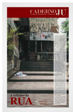
Clique sobre a imagem para acessar o pdf da edição no Lume, o Repositório Digital da UFRGS

Leia a reportagem completa publicada em dezembro de 2015 no JU impresso n.º 187.