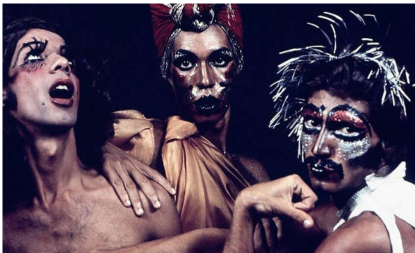
Figura 4 — Alguns membros do Dzi Croquettes

O grupo composto por artistas masculinos, barbados e de pernas peludas chocou a sociedade ao se apresentarem de salto alto, vestidos e glitter na maquiagem, tornando-se o escândalo e o deleite dos públicos do Brasil e de Paris. O Dzi Croquettes alcançou reconhecimento internacional por sua postura política e artística, o que destaca que o grupo formado por esses 11 artistas militantes da causa gay em paetês foram os precursores do que enxerga-se hoje como drag queen no Brasil.