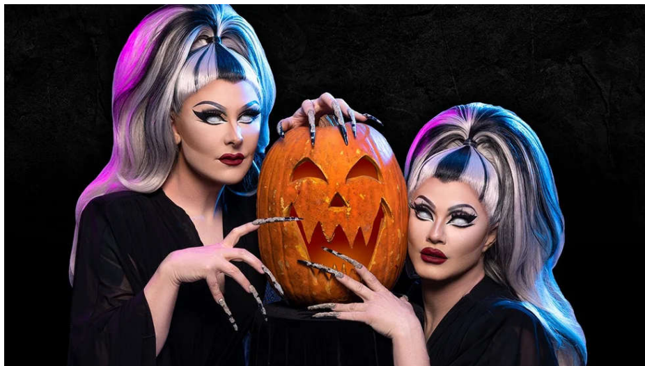
Figura 11 — Dracmorda Boulet e Swanthula Boulet, conhecidas como The Boulet Brothers , apresentadoras do reality show The Boulet Brothers' Dracula