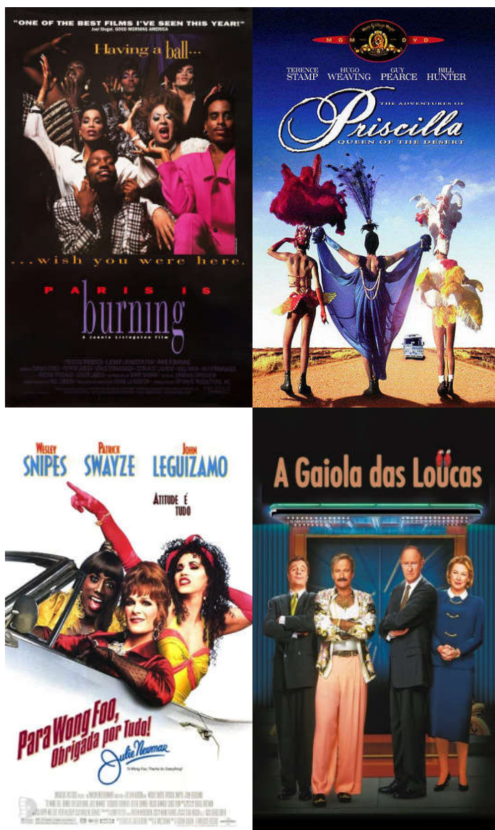
Figura 3 — Cinema como plataforma de atuação e inserção drag: posters dos filmes “Paris Is Burning”, “Priscilla, a Rainha do Deserto”, “Para Wong Foo, Obrigada por tudo! Julie Newmar” e “A Gaiola das Loucas”.

documentário Paris Is Burning (1990) e filmes como Priscilla, a Rainha do Deserto 10 (1994), Para Wong Foo, Obrigada Por Tudo! Julie Newmar (1995) e o remake hollywoodiano de A Gaiola das Loucas (1996) ajudaram a difundir as práticas e costumes da cultura drag 7 .