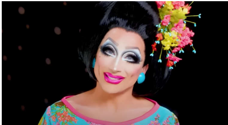
Figura 7 — Bianca Del Rio, drag do tipo comedy queen

Rosa (2018) também fala das comedy queens , que são as manas que trabalham com o humor e a satirização. Bianca Del Rio é uma das artistas que utiliza dessa abordagem (Figura 7);