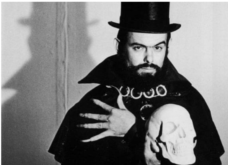
Figura 14 — Personagem Zé do Caixão, criado e interpretado pelo cineasta brasileiro José Mojica Marins

O horror é uma categoria utilizada em diversas produções nacionais. Um exemplo clássico de personagem do horror brasileiro a ser citado é Zé do Caixão (Figura 14), criado e interpretado pelo cineasta José Mojica Marins, em seis de suas obras cinematográficas das quais são protagonizadas pelo personagem, sendo elas: “À meia-noite levarei sua alma” (1964), “Esta noite encarnarei no teu cadáver” (1967), “O despertar da besta” (1970), “Exorcismo negro” (1974), “Delírios de um anormal” (1978) e, por fim, “Encarnação do demônio” (2008).