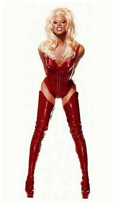
Figura 2 - RuPaul Charles, uma das drag queens mais famosas da história, estrelando uma campanha para a marca de cosméticos MAC em 1994

Mediante essa avalanche cultural de diferentes possibilidades, os artistas drag queens possuíam um grande material para se comunicar com seu público. As inspirações eram muitas e as grandes divas hollywoodianas e da música pop alicerçaram um imaginário irreverente, fashionista e soberbo da imagem da mulher que é maior que o mundo. Judy Garland, Marilyn Monroe, Betty Davis, Barbra Streisand, Cher, Diana Ross, Madonna, Etta James e tantas outras proporcionaram a todos os personificadores femininos um vasto material e desejo de magnificar suas performances.