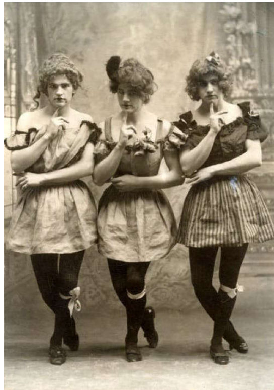
Figura 1 — Atores masculinos caracterizados como mulheres no teatro em 1883