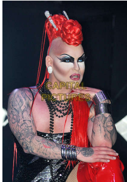
Figura 8 — Nina Flowers, drag do tipo butch queen