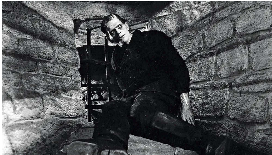
Figura 13 — Frankenstein , de James e Boris Karloff (1931)