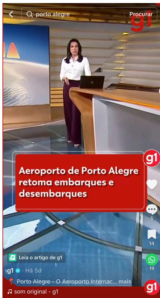
Figura 9 — Corte de programa