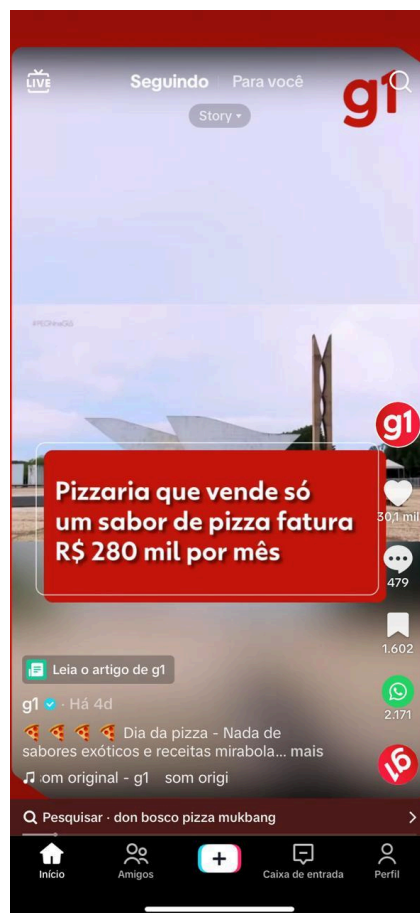
Figura 3 — Feed Seguindo