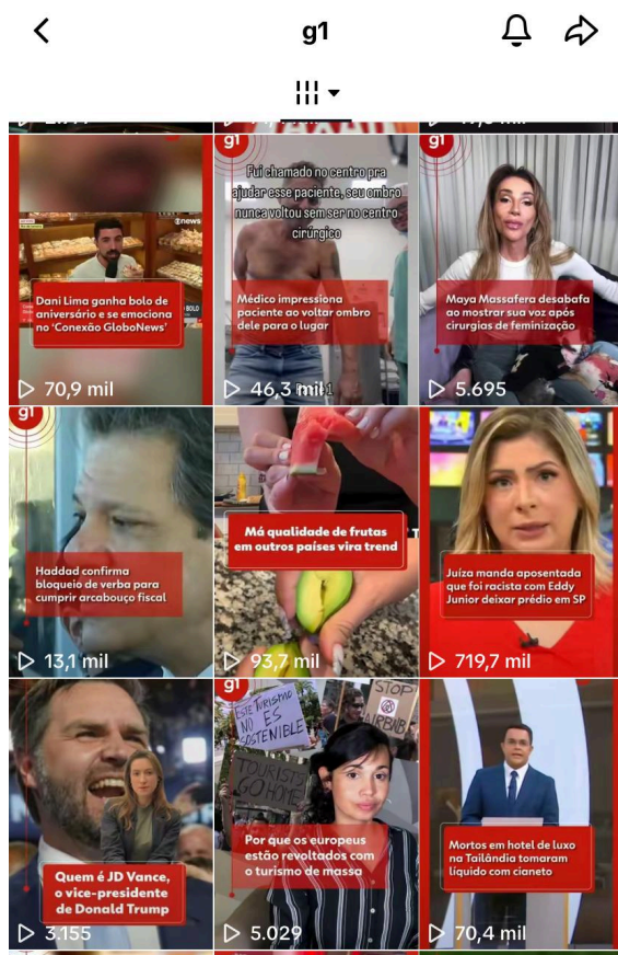
Figura 6 — Feed g1

vermelha, também é facilmente encontrada em todos os seus conteúdos. Além de aparecer na cor do seu logo, o vermelho é observado em manchetes e créditos e, eventualmente, no cenário dos vídeos gravados com os jornalistas na redação.