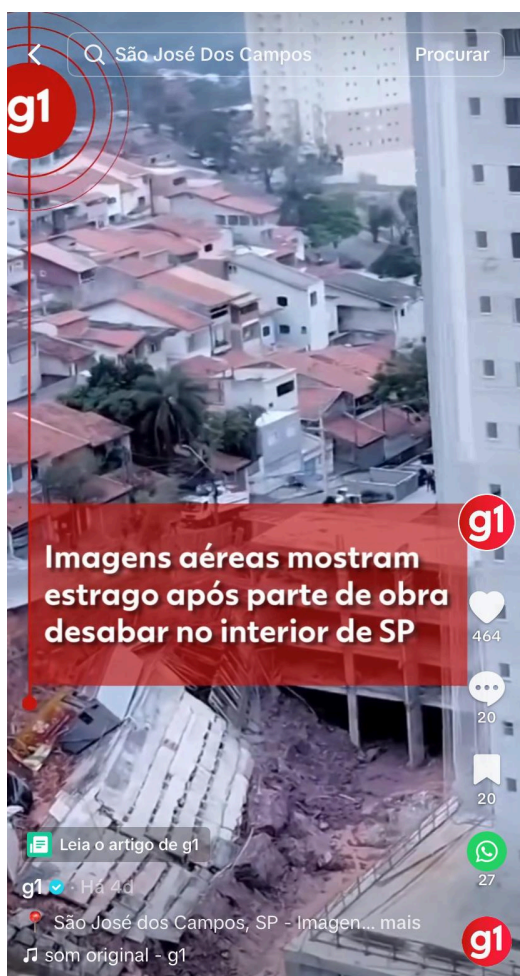
Figura 11 — Vídeo amador