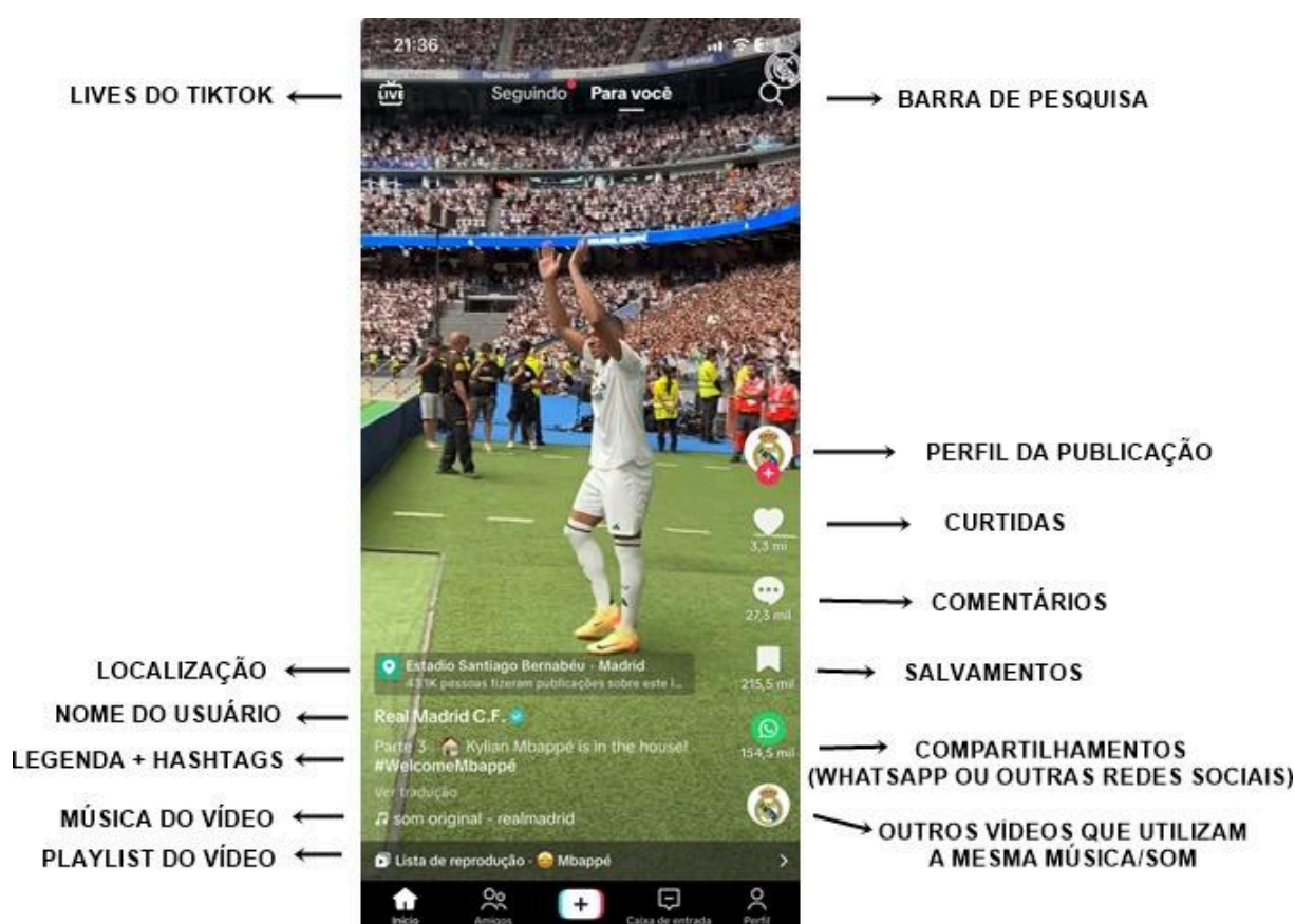
Figura 1 — Página Inicial do TikTok

O TikTok dispõe de ferramentas próprias para criadores na plataforma. Efeitos, uso de hiperlinks nas publicações, utilização de locuções, músicas, criação de playlists e uso de hashtags nos vídeos são alguns dos recursos oferecidos aos produtores de conteúdo.