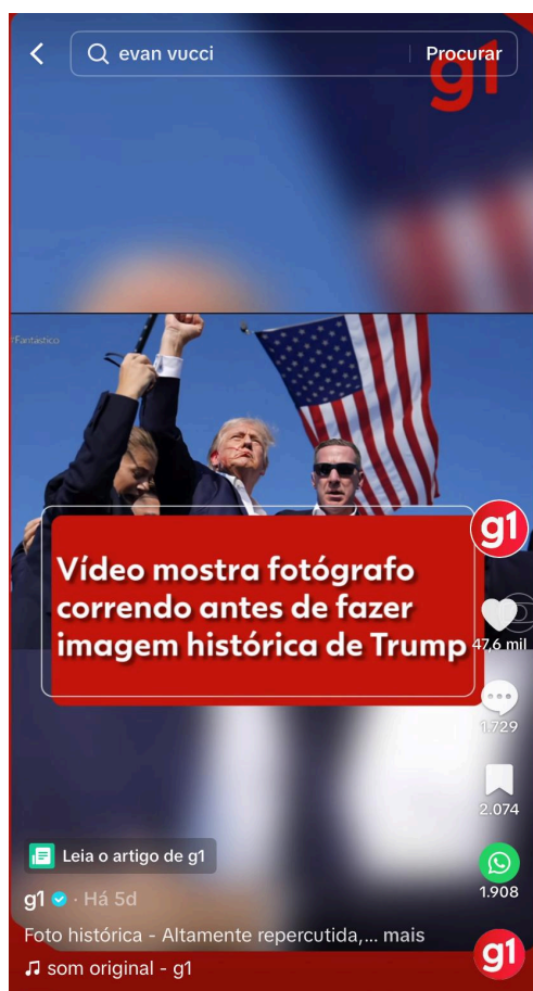
Figura 10 — Corte do programa Fantástico, da TV Globo