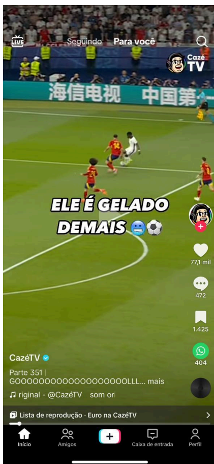
Figura 2 — Feed “Para Você”