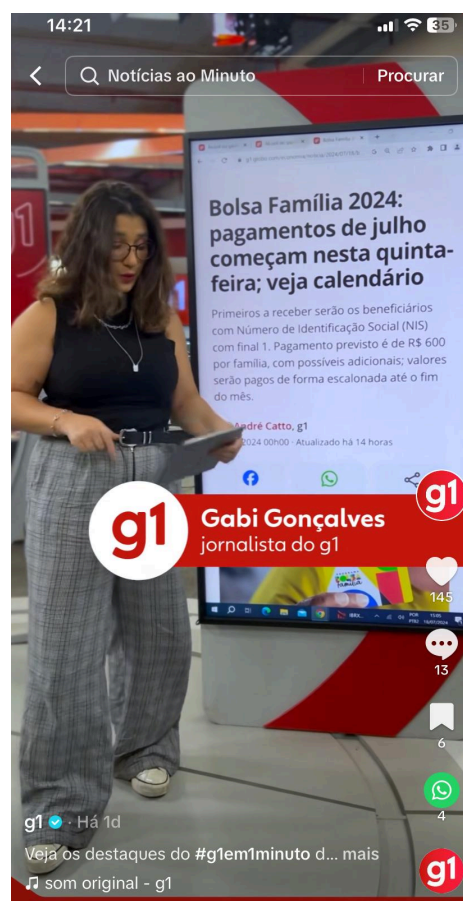
Figura 7 — Créditos