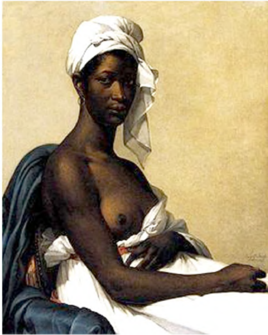
BENOIST, Marie-Guillemine. Portrait d'une négresse (1800). Musée du Louvre, Département des peintures. Disponível em: < https://fr.wikipedia.org/wiki/Portrait_d%27une_n%C3%A9gresse#Titre_du_tableau >.

Sublinhe-se, como dado fundamental à exposição no Musée d'Orsay, seu esforço em observar a representação de sujeitas(os) negras(os) desde um cânone da pintura ocidental, sobretudo em quadros alusivos ao período de escravização nas colônias francesas nas Américas. O quadro de Benoist fora pintado imediatamente após a [primeira] abolição da escravização nas colônias francesas 29 ; e imediatamente antes do desfecho da Revolução Haitiana (1791-1804) 30 . Acerca do quadro, observemos seu percurso de renomeação: de “Portrait d'une négresse”, doravante se encontra em exposição permanente no Musée du Louvre, denominado “Portrait d'une femme noire”, com subtítulo “Salon de 1800, sous le titre Portrait d'une négresse”; e, com o advento da exposição inicialmente referida neste texto,