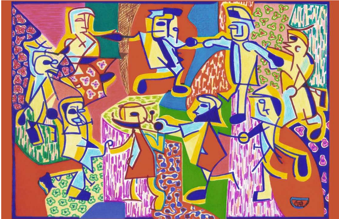
Figura 2 – Ciranda, obra de Wladimir Correia Durão, São Paulo (SP)