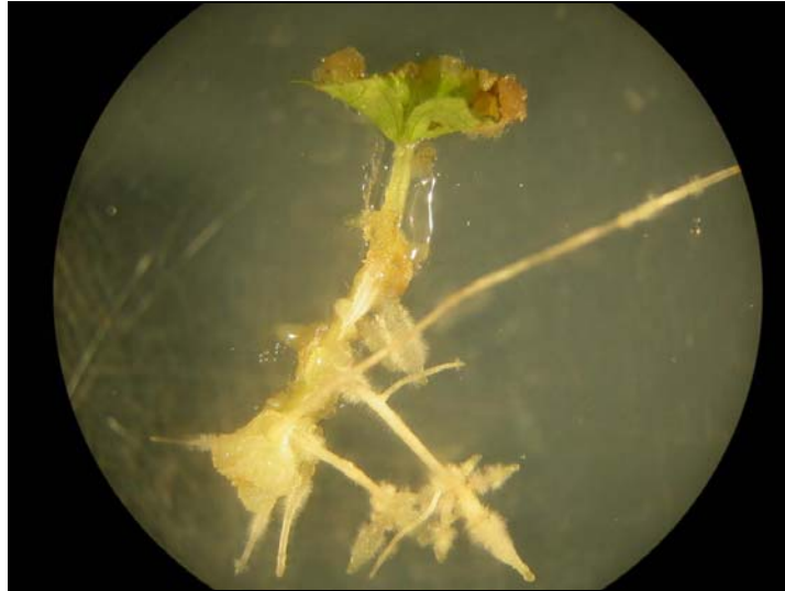
FIGURA 4 – Explante de videira, meia folha com pecíolo, com incremento no número de raízes e a formação de calos em meio com presença de ácido indolbutírico.

concentração de auxina no meio de enraizamento é excessiva, há a formação de calo na base do explante, comprometendo a rizogênese e o crescimento da parte aérea.