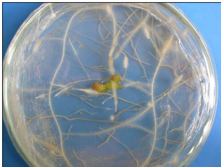
FIGURA 2 – Enraizamento de segmento basal de tomateiro na ausência de ácido indolbutírico.

A cultura de tomate foi a que melhor respondeu ao enraizamento, independentemente da presença de AIB no meio (Figuras 2 e 3). Supõe-se que esta resposta se deva ao genótipo. Segundo Nogueira et al. (2001), o tomateiro é um material adequado para a utilização das técnicas de cultura de tecidos, assim como outras espécies de Solanaceae. Alguns membros dessa família, como espécies dos gêneros Datura , Nicotiana e Petunia , tornaram-se modelos para trabalhos in vitro .