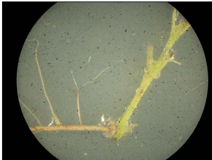
FIGURA 1 – Explante de videira, formado por dois segmentos basais com raiz primária, em placa de Petri.

O enraizamento de explantes de videira, folhas com pecíolo e a utilização de um segmento basal com raiz primária, foi eficiente, pois com a aplicação de AIB observou-se a formação de um grande número de raízes ao longo de toda a raiz primária e de todo o pecíolo foliar. Ao contrário do que se observou em meios de manutenção da cultura estoque, na qual a ausência de AIB, promoveu a elongação das raízes e poucas raízes novas foram emitidas. Para a seleção de explantes de videira optou-se por iniciar o cultivo in vitro de raízes, com os explantes formados por um segmento basal com raiz primária (Figura 1) ou folhas com pecíolo, sendo que os dois desenvolveram raízes ramificadas.