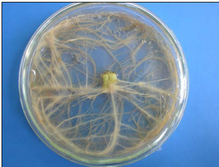
FIGURA 3 – Enraizamento de segmento basal de tomateiro na presença de ácido indolbutírico.

Segundo Análise de Variância (Anexos 6 e 8), não houve interação significativa entre a origem dos explantes (meia folha com pecíolo e segmento basal com raiz primária) do porta-enxerto SO4 de videira e as doses de AIB. Também não houve diferenças significativas entre os explantes com relação ao número e comprimento médio de raízes.