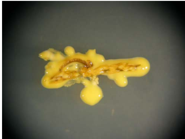
FIGURA 6 - Segmento nodal de menta com contaminação por microrganismo, principalmente bactéria.

Para um estudo futuro, que dê continuidade ao trabalho de produção de raízes in vitro recomenda-se que sejam feitas amostragens maiores ou, quem sabe, intervalos maiores entre as avaliações, ou até mesmo, doses maiores de AIB, testando outros protocolos de micropropagação para a cultura da menta, a fim de tentar solucionar os problemas no enraizamento desta cultura.