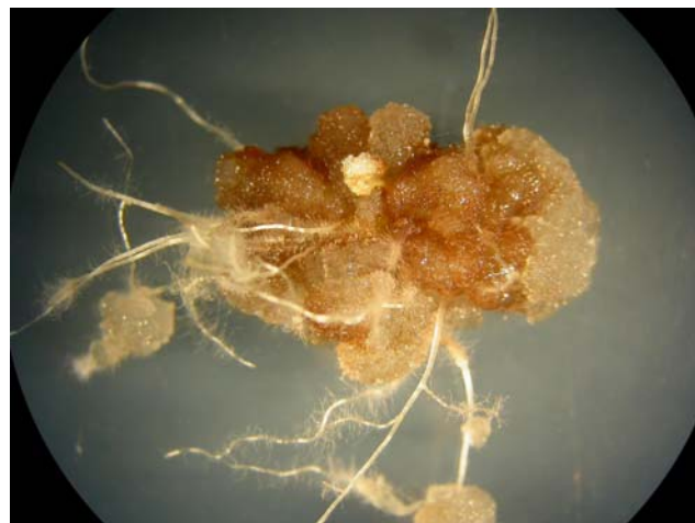
FIGURA 7 – Formação de calos e raízes em segmento nodal de menta.