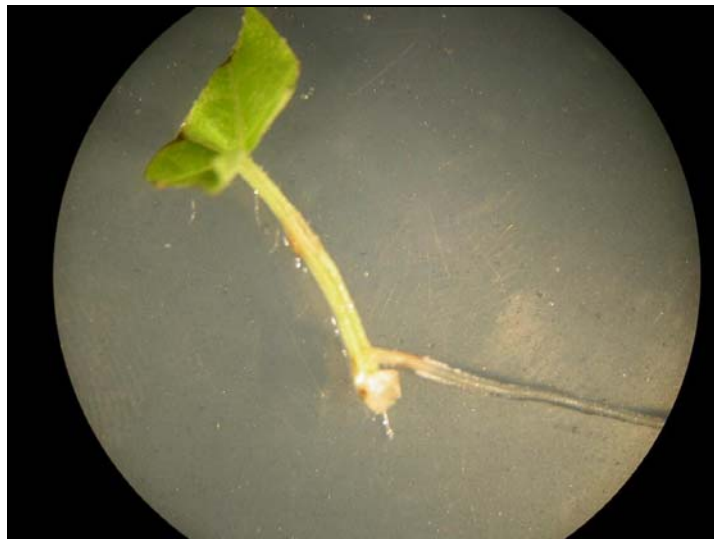
FIGURA 5 – Explante de videira, meia folha com pecíolo, com a alongação de uma raiz em meio com ausência de ácido indolbutírico.

Segundo Análise de Variância (Anexo 10), não houve interação significativa entre as doses de AIB e a origem dos explantes (segmentos basal e nodal) para a cultura da menta. Também não houve diferenças significativas entre os explantes quanto ao número e