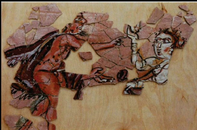
Reconstituição de mural encontrado em uma casa romana tardo antiga abandonada em 360 d.C..A figura mostra uma ninfa e um sátiro em dança ritualística.