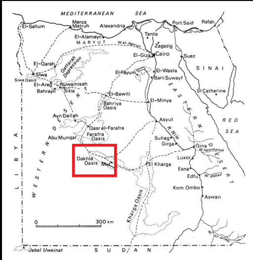
Mapa da ocupação romana no Egito com destaque para a localização do Oásis de Dakhleh