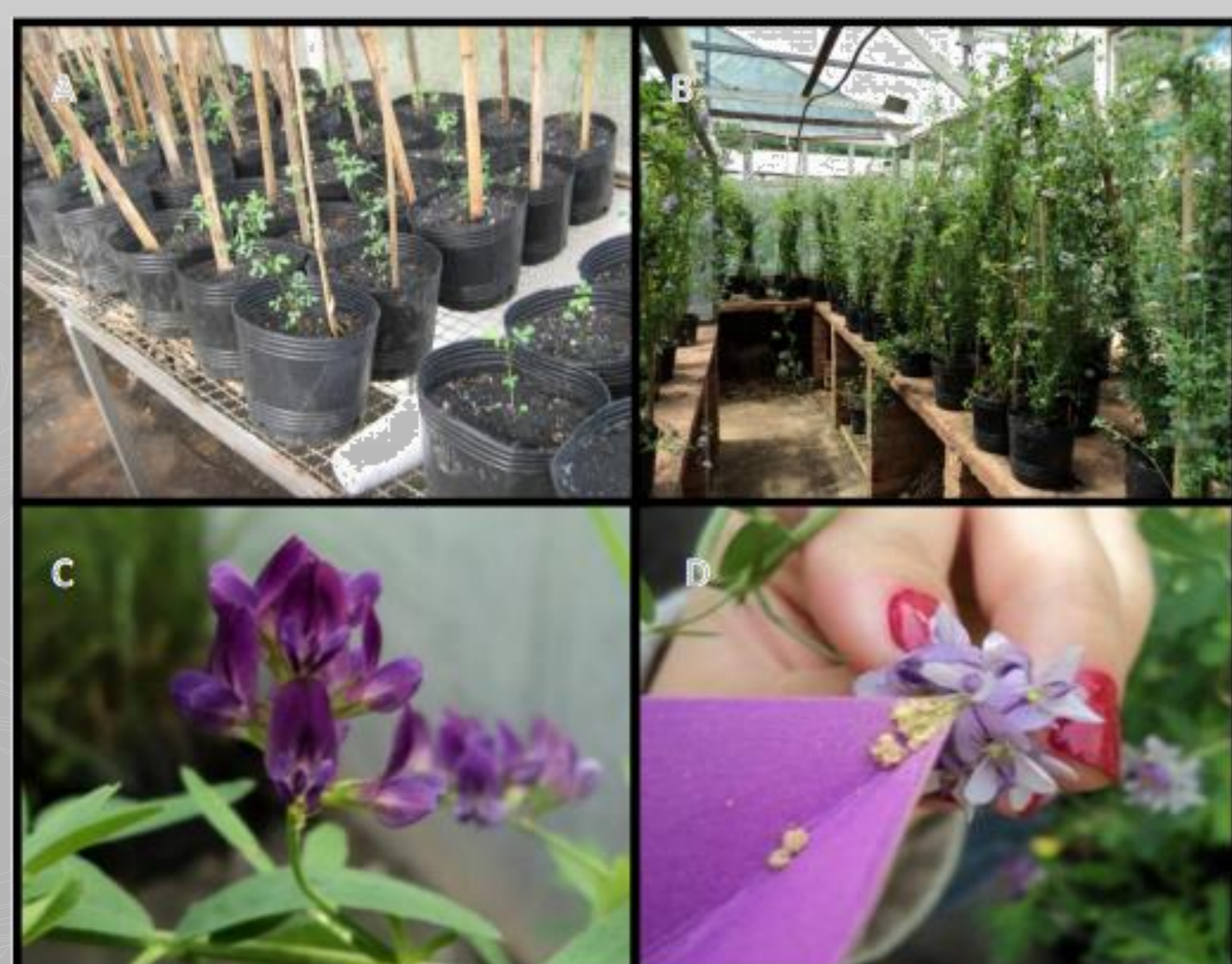
FIGURA 2. Plantas de alfafa ( Medicago sativa L.) em casa-de-vegetação (A); início do florescimento (B); inflorescência (C); polinização (D).