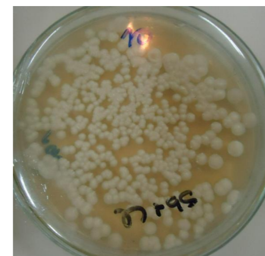
Figura 1: Isolamento de colônias de Malassezia pachydermatis .

Das 25 amostras coletadas 24 (96%) obtiveram crescimento de alguma espécie fúngica. Em 4 (16%) houve crescimento de fungos filamentosos e em 21 (84%) de leveduras. Após identificação observou-se o crescimento das seguintes espécies Malassezia pachydermatis (Fig. 1) em 1(4%), Candida albicans (Fig. 2) em 7 (28%), C. guilliermondii em 1 (4%), C. famata em 2 (8%), Aspergillus sp. 3 (12%), A. níger em 1 (4%), Penicillium sp. em 1 (4%) e em uma amostra (4%) não houve crescimento fúngico. Sendo que destas, cinco amostras (20%) houve isolamento de mais de um fungo por amostra (quadro 1).