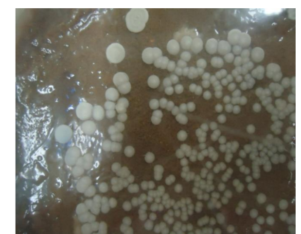
Figura 2: Isolamento de colônias de Candida albicans .