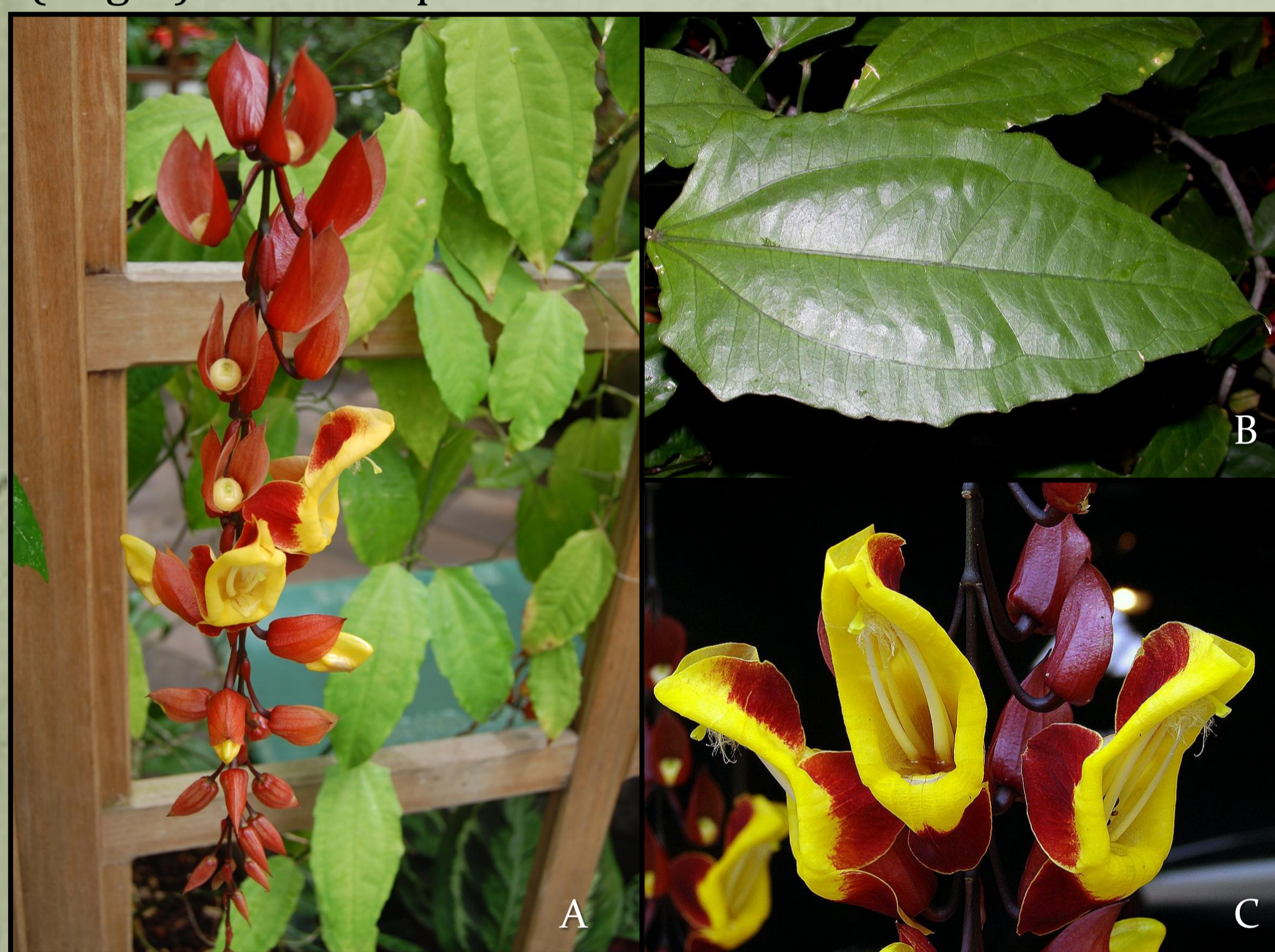
Figura 1: Sapatinho-de-judia ( Thunbergia mysorensis (Wight)). A) Inflorescência; B) Folha; C) Flores. Fonte: faroutflora.com; plantsystematics.org; orkut.com. Autores desconhecidos. Acesso em: 20/09/2011.

Avaliar o efeito de doses de ácido indolbutírico (AIB) no enraizamento de estacas de Thunbergia mysorensis (Wight) em duas épocas.