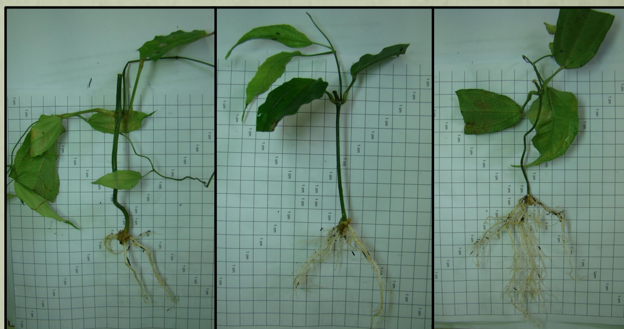
Figura 2: Exemplo de variações na formação de raízes e brotações em estacas de sapatinho-de-judia.

Em E1, não ocorreu diferença significativa para nenhuma das variáveis analisadas (%E, VR, MSR, MSB, MNFR); a %E média foi de 52% (Figura 2). Em E2, o NR e MSMR foram significativos e lineares, apresentando um incremento de 0,84 raízes estaca -1 e um decréscimo de 0,017g raiz -1 ,(Figura 3) a cada aumento de 1g L -1 de AIB; o VR foi superior em T4 (p<0,05); não houve aumento na MSR, MSB e MNFR por estaca enraizada com o aumento da dose de AIB; a %E não foi diferente entre os tratamentos, sendo em média 96% (Tabela 1).