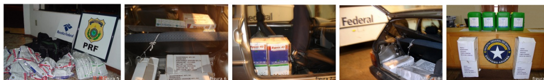
Foto 1: Apreensão de Agrotóxicos. Foto 2: Apreensão de Defensivos. Foto 3: Apreensão de Herbicida. Foto 4: Caminhão com 5.000 litros de Defensivos. Foto 5: Apreensão de agrotóxicos em Rosário do Sul Foto 6: Apreensão de 100 l de agrotóxicos em Livramento Foto 7: Apreensão de 100 l de agrotóxicos em Livramento Foto 8: Apreensão de 100 l de agrotóxicos em Livramento Foto 9: Apreensão de 80 l de agrotóxicos em Jaguarão

Fontes: 1 a 4: Informante PRF 5 a 9: Blog Direp10: http://direp10.blogspot.com/