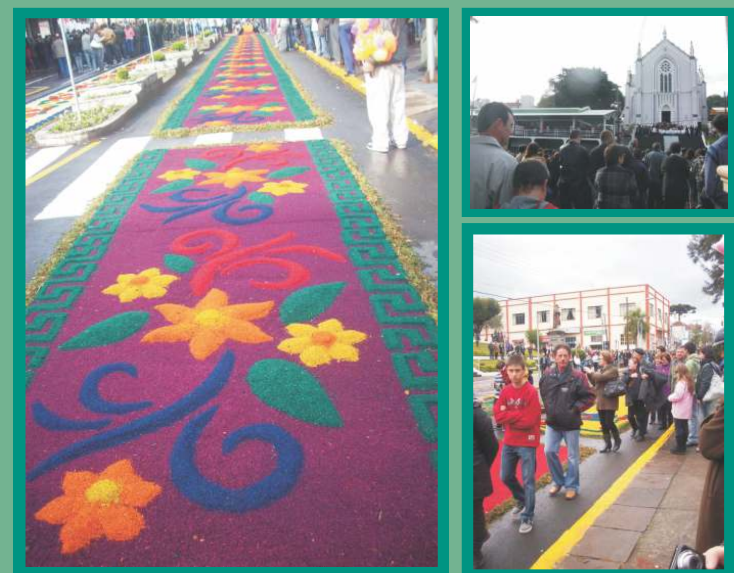
Fotos da celebração de Corpus Christi em Flores da Cunha. Foto do tapete de serragem, da celebração da missa e da procissão em volta da praça.

Identificar os condicionamentos linguísticos e sociais do emprego de vibrante simples em lugar de múltipla. Investigar se o processo é variação na mudança em progresso, se encontra-se estável ou se regride na comunidade. E discutir o padrão de variação e mudança em relação às práticas sociais dos falantes.