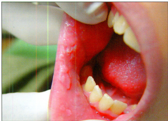
Fig. 1. Hiperplasia focal del Epitelio en la zona retrocomisural.