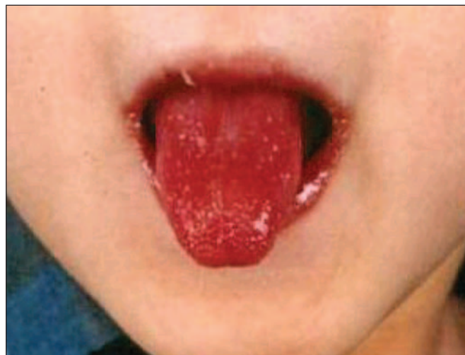
Fig. 2. Lengua de "frambuesa" y eritema con fisura labial.

Los exámenes laboratoriales realizados mostraron: PCR (Proteína C Reactiva) y VSG (Velocidad de Segmentación Globular), que son marcadores inflamatorios e infecciosos aumentados, y demás exámenes