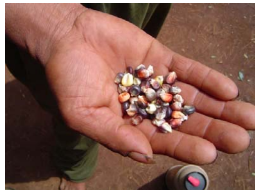
Grãos de avati

O avati ete é popularmente conhecido no Brasil como “milho cateto” ou “milho saboró” (Souza, 1987; Vietta, 1992). Para os Mbyá-Guarani ele é a flor da terra, possuindo grande importância prática e simbólica na manutenção do nhandé rekó 41 (Silva, no prelo). Além de ser alimento físico, ele também