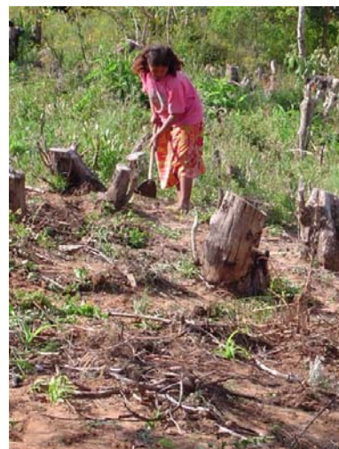
Roça entre os tocos

de linhas retas), muitas vezes os produtos plantados avançam para dentro do mato 46 . Também os espaços para o plantio de cada espécie não são delimitados, ocorrendo muitas vezes que uma espécie avance sobre a área em que está plantada uma outra espécie. É muito comum os Mbyá-Guarani plantarem em um mesmo terreno duas ou mais variedades diferentes, por exemplo a plantação de abóboras entre os pés de mandioca ou a plantação de batata-doce entre os pés de milho. Os grandes tocos, de difícil remoção, permanecem entre os produtos cultivados. Também o modo de semear difere dos brancos, pois o número de sementes e os espaçamentos entre as plantas respeitam as regras tradicionais deste povo. A época da sementeira