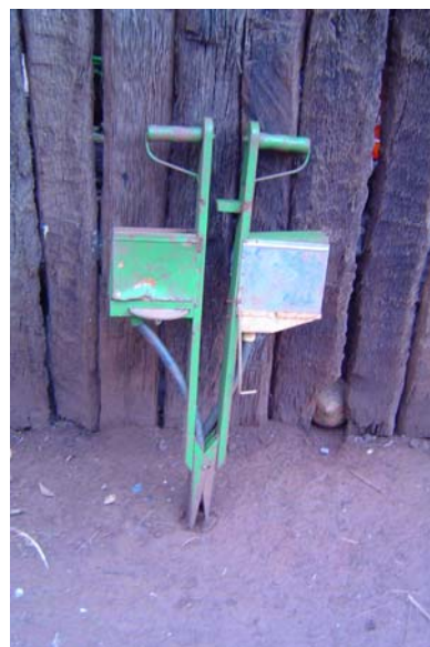
Plantadeiras utilizadas na semeadura das roças

Porém, segundo os próprios Mbyá-Guarani, essa forma diferenciada de plantio vem sendo alterada, aos poucos é bem verdade. Numa tarde na aldeia de Itapuã presenciei um pequeno mutirão para a retirada dos tocos em uma área onde logo seria semeado o milho. Mais tarde, na mesma aldeia, percebi que as pequenas mudas estavam distribuídas em linhas retas. Já na aldeia do Ñacapetum o quadro é bastante diferente: grandes áreas (sem tocos) são semeadas com o emprego de plantadeiras manuais e arados com tração bovina, as plantas são distribuídas em linhas e as espécies são plantadas em ambientes separados.