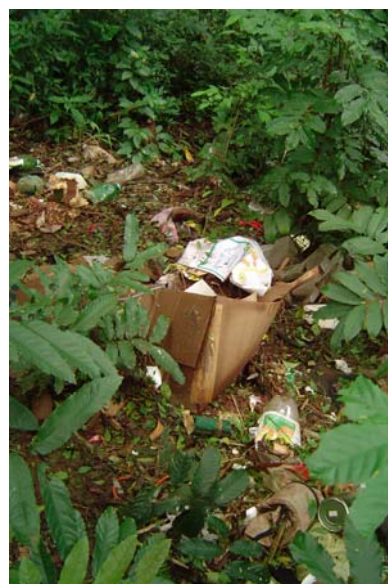
Descarte de embalagens de produtos alimentícios

Uma maneira interessante de perceber o que os Mbyá-Guarani costumam adquirir no mercado, que me foi bastante útil no início do meu campo, é observar as embalagens descartadas. As noções dos Mbyá-Guarani sobre o que é “lixo” e “lixreira” são muito diferentes das noções da nossa sociedade. O que para nós é “lixo” para eles não é. Eles não tem um local para o descarte das coisas que não serão mais utilizadas, simplesmente as jogam em qualquer lugar, pelo pátio, em torno da casa, etc. Assim ocorre com todo tipo de “lixo”. O que para nós seria o “lixo orgânico” é rapidamente decomposto ou comido pelos animais soltos no pátio. Porém as embalagens dos produtos comprados permanecem, oferecendo bons indícios sobre as suas práticas alimentares. Cito um exemplo da utilidade destes dados: um Mbyá-Guarani da aldeia de Itapuã certa vez me disse que a cachaça não era consumida por nenhum indivíduo da aldeia porque ela faz mal, mas pelo chão é possível encontrar inúmeras garrafas de cachaça vazias, sendo que a maioria delas foi consumida recentemente, pois ainda estavam com o rótulo intacto.