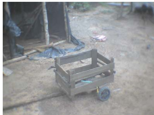
Carrinho utilizado na coleta

Todo passeio pelo mato acaba sendo uma coleta. Constantemente eles param, se afastam da trilha para comer uma frutinha, arrancar folhas de uma planta medicinal, tirar a casca de uma árvore, arrancar uma raiz, etc. Antigamente os produtos da coleta eram levados para as casas em cestos e porongos, atualmente são utilizados sacos plásticos, baldes e até carrinhos.