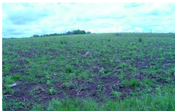
Roças sem tocos na aldeia do Ñacapetum

sendo praticadas diariamente até o fim da colheita. Como quando se está colhendo um