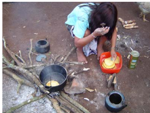
Fazendo o chipá na fogueira

de lugar. Podem ser feitas dentro das casas ( oga ), em dia de chuva ou com muito vento frio. Pode ser feita na beira do rio, em dia de pescaria ou de lavar as roupas. Também pode ser feita na roça, para alternarem o trabalho na roça com a preparação da comida. Enfim. Na aldeia de Itapuã presenciei uma família fazendo a fogueira e cozinhando junto aos tocos que devem ser queimados para limpar a terra para o plantio, “matando dois coelhos com uma cajadada só”. Na aldeia de Itapuã, na maioria das vezes a fogueira é acesa pelo pátio em torno das casas. Já na aldeia do Ñacapetum, onde a maioria das famílias possui casas