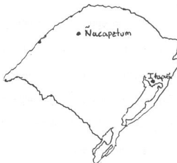
Localização das aldeias no mapa do estado do Rio Grande do Sul

muitos Mbyá-Guarani, comer com eles, dormir na aldeia (na casa de uma família Mbyá-Guarani), etc. Pude buscar novos dados e conferir os que já tinha obtido em Itapuã. Essa estada na aldeia do Ñacapetum também me foi de grande valia, pois pude perceber que a alimentação deste grupo assume formas diferentes variando em função das condições ambientais das aldeias, do acesso aos recursos monetários e da proximidade com os estabelecimentos comerciais. Se eu tivesse me limitado apenas à aldeia de Itapuã talvez não