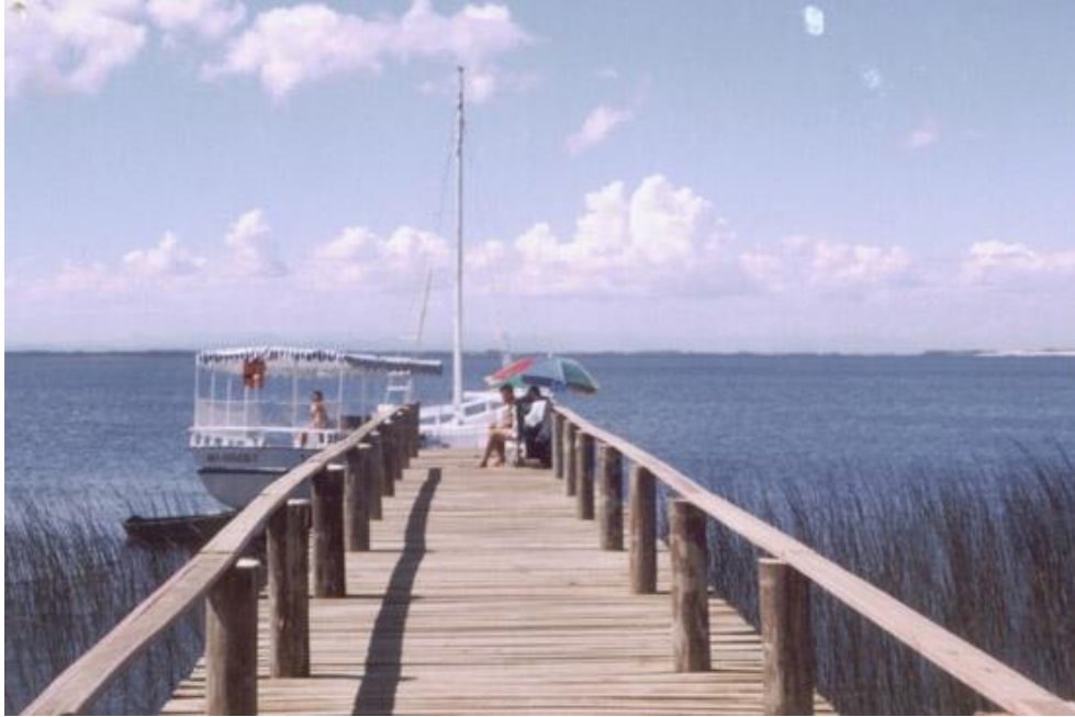
Lagoa da Rondinha