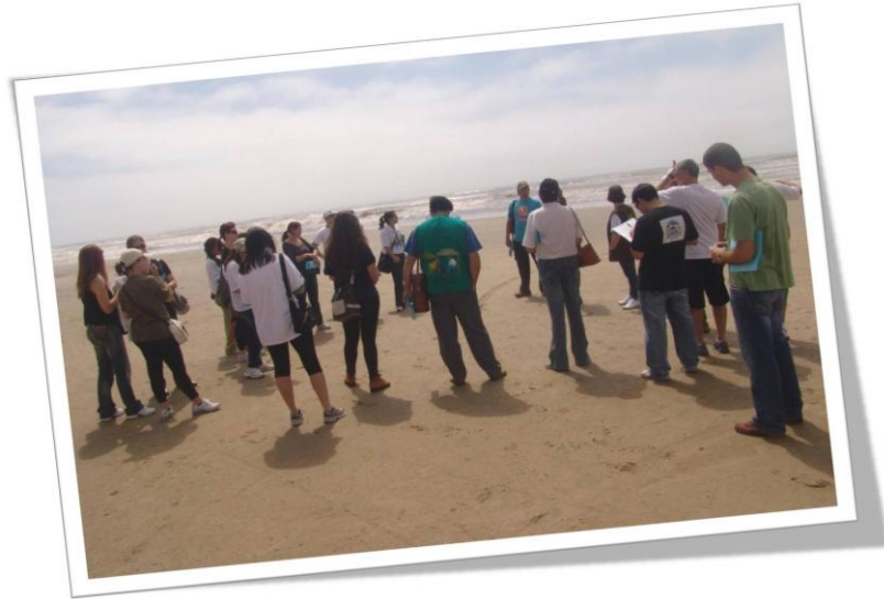
Figura 1 – Foto caminhada à beira mar