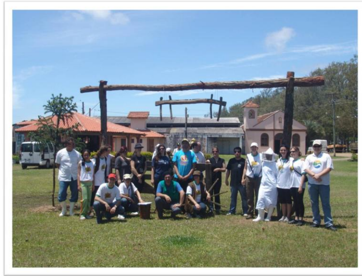
Figura 3 – Foto da Vila do Mel - visita ao complexo - Salão Bailes, Escola, Igreja, Casa do Mel, Quiosque.