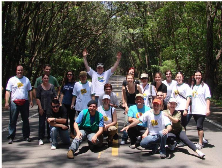
Figura 6 – Foto da visita ao Túnel Verde para fotos