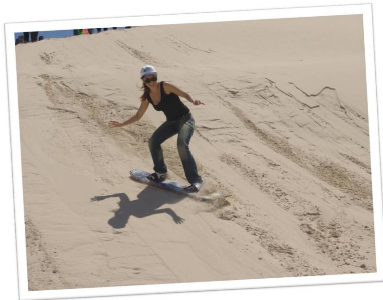
Figura 2 – Foto Esquidunas/ stadboards