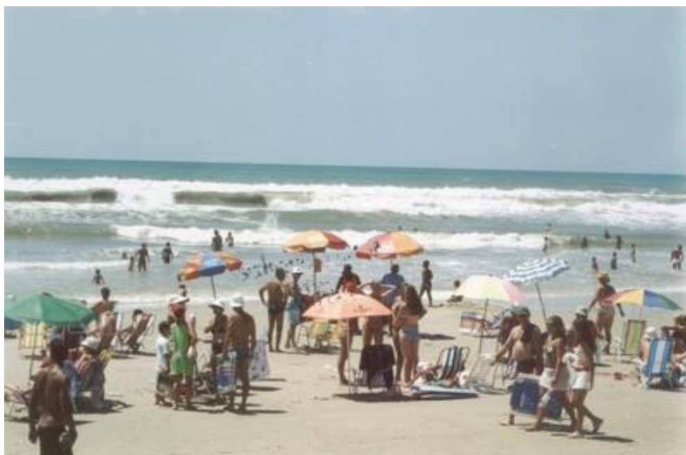
Veranistas a beira mar