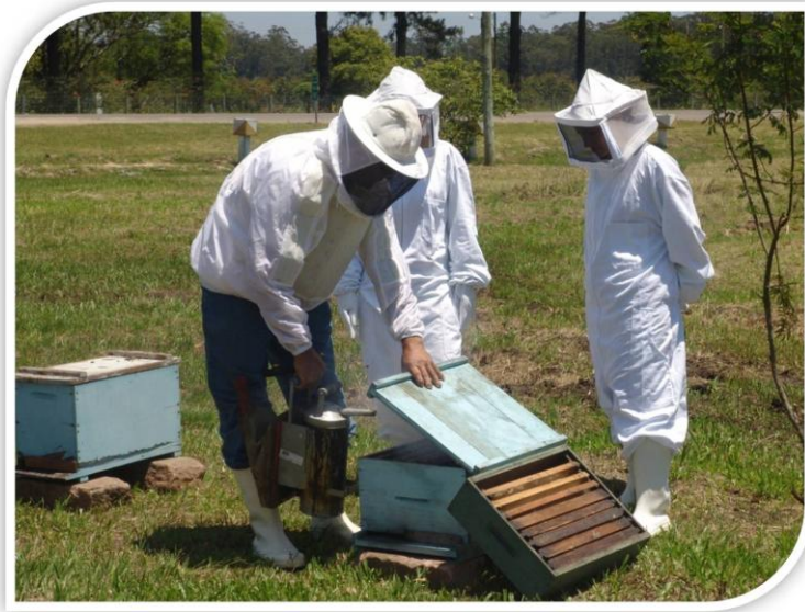
Figura 5 – Foto Vivência com apicultores