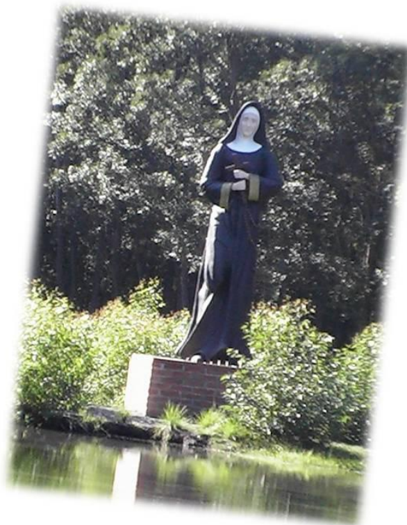
Figura 4 – Foto Reflexão no largo Verde