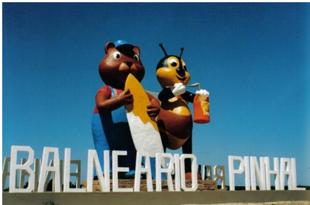
Melinha e Meladinho