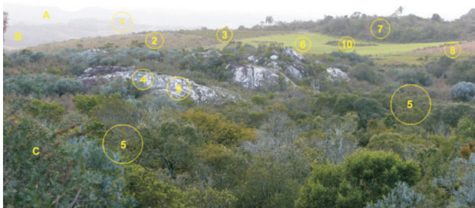
Figura 2 – Leitura da Paisagem – Estabelecimento rural no município de Pinheiro Machado – Rio Grande do Sul