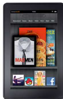
Figura 6 – Kindle Fire

Kindle Fire - Tablet concorrente do iPad. O tablet da Amazon tem conexão WiFi e roda o sistema operacional Android do Google. Seu peso é de 400 gramas e possui tela de 7 polegadas.