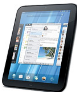
Figura 8 – HP TouchPad 4G

HP TouchPad 4G – Novo tablet da HP, com conexão 4G, sistema operacional WebOS, (sistema operacional desenvolvido pela própria HP). Possui memória de 32 GB, WiFi , Bluetooth e tela de 9,7 polegadas.