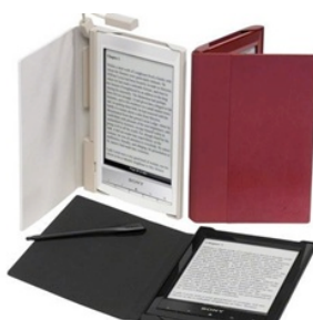
Figura 2 – Sony Reader WiFi

Sony Reader WiFi – Tem tela e-ink touchscreen de 6 polegadas, possui conexão WiFi (tecnologia que permite a conexão com a internet ou entre vários dispositivos sem fio), memória de 1,3 GB e pesa somente 168 gramas. Será o primeiro leitor de livros eletrônicos a fornecer conectividade sem fio com os sistemas de bibliotecas públicas do Canadá e dos Estados Unidos. O sistema contará com um ícone dedicado no dispositivo, que permite o empréstimo de e-books de forma simples, mediante a apresentação do cartão da biblioteca.