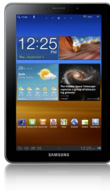
Figura 9 – Galaxy Tab 7.7

Galaxy Tab 7.7 – A nova versão do tablet da Samsung tem 7,87 milímetros de espessura, pesa apenas 335 gramas e tem tela de 7,7 polegadas. Possui sistema operacional Android e já vem pré-carregado com todo o conjunto de serviços Google Mobile Services .