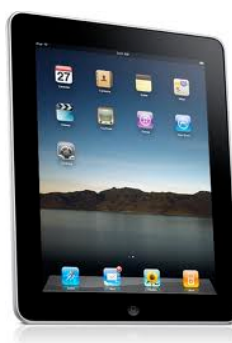
Figura 11 – iPad 3

iPad 3 – Novo tablet da fabricante Apple. Possui tela de 9.7 polegadas com resolução 2048 x 1536 e suporte para rede 4G com possibilidade de conexão para redes 3G. O iPad possui duas câmeras (uma na parte frontal e outra na parte traseira). A bateria foi melhorada para acompanhar a demanda dos gráficos, porém a sua duração se mantém igual ao iPad 2, 10 horas. Sistema operacional iOS 5.1. O peso do iPad 3 é 635 gramas.