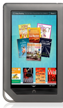
Figura 12 – Nook Color