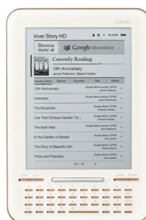
Figura 4 – Story HD

Story HD – E-reader fabricado em parceria da Iriver com o Google, sendo este o primeiro e-reader integrado com o Google Books. O Google Books é uma plataforma da Google que fornece mais de 3 milhões de livros, tanto pagos como gratuitos, com leitura direto no e-reader . Até então para acessar esse conteúdo em um leitor eletrônico de livros, era necessário baixar o conteúdo escolhido em um computador e então transferi-lo para o dispositivo e-reader . Com o e-reader Story HD, os usuários do Google Books terão um dispositivo próprio para baixar os conteúdos diretamente para o aparelho através de conexão Wi-Fi e armazenar os livros em uma “prateleira” nas nuvens. O e-reader possui tela de 6 polegadas com tecnologia e-ink 2 , conexão WiFi e bateria com duração de 6 semanas.