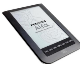
Figura 3 – Alfa WiFi