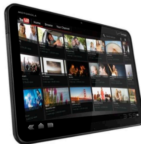
Figura 10 – Motorola Xoom

Motorola Xoom - É o primeiro aparelho com o sistema operacional Android 3.0, uma plataforma projetada especificamente para os tablets . Possui tela de 10,1 polegadas, conexão 3G, Bluetooth , Wi-Fi , 32 GB de memória e pesa 730 gramas.