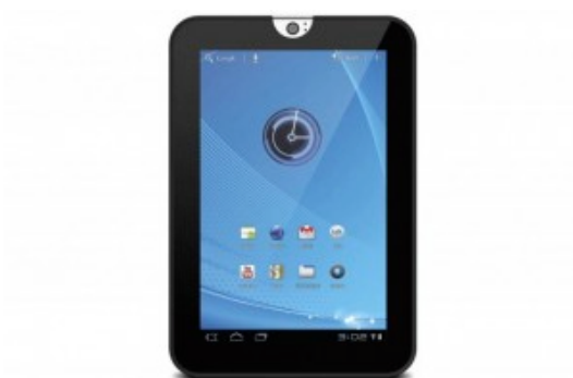
Figura 7 – Toshiba Thrive 7

Toshiba Thrive 7 - Possui tela de 7 polegadas, sensível ao toque. Capacidade de armazenamento de 16 GB ou 32 GB. Possui conectividade WiFi , Bluetooth e GPS . Seu peso é de 400 gramas.