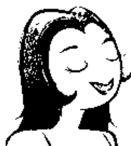
Fig. 1: bico-de-viúva – ilustração sugerida

Para que a ilustração apresentada pelo DUPC (2004) auxiliasse na compreensão do significado da palavra bico-de-viúva , deveria ser semelhante ao desenho abaixo, onde o que se conhece por bico-de-viúva está mais evidente: