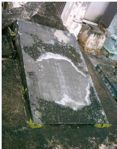
Figura 05: Lápide superior – Havia um epitáfio que se apagou e que dizia o seguinte: “Tenho a consciência tranquila pois cumpri meu dever” 181 (Acervo pessoal).