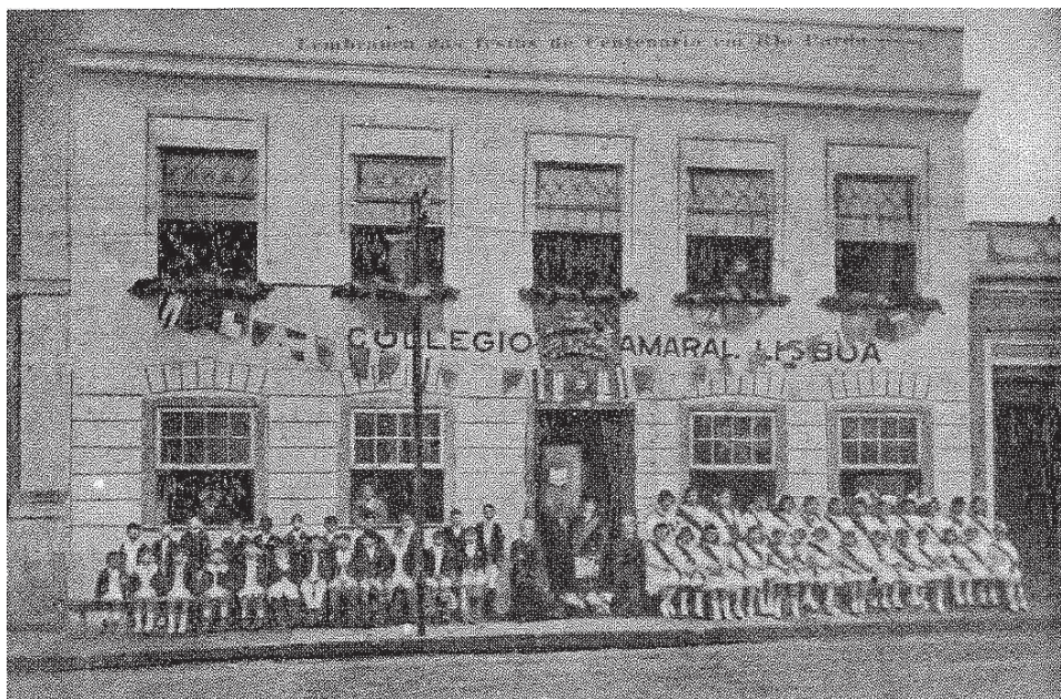
Figura 13 - Foto tirada após passeata cívica de 7 de setembro de 1922.

Na imagem abaixo, observa-se o prédio em que funcionou, até 1927, o Colégio Amaral Lisboa, localizado na Rua Andrade Neves, no centro de Rio Pardo: