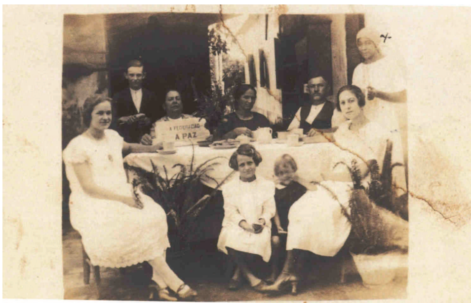
Figura 11 – Campo Bom – RS, 1923.