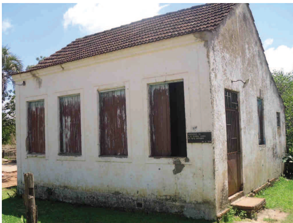
Figura 15 - Foto da casa-escola de Ana Aurora - janeiro de 2010. Na placa está registrado: “Homenagem do G. E. Amaral Lisboa as suas patronas – 24/09/1978”.

Na imagem seguinte – da última morada da professora rio-pardense, situada na Avenida dos Amarais, Bairro Boa Vista, em Rio Pardo – aparece a casa-escola de Ana Aurora, em seu estado atual: