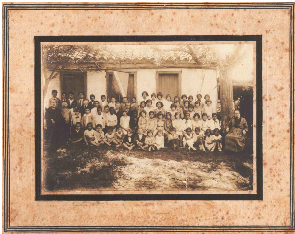
Figura 17 - São Gabriel da Estrela - dezembro de 1931.