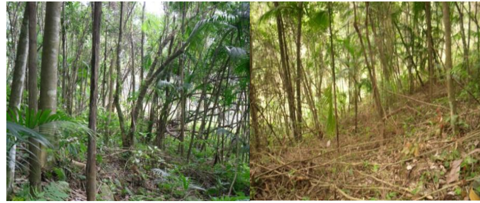
Figura 04 –Manejo da regeneração inicial para adensamento com plantio de juçara e anuais. Fonte Everson Fleck, Junho 2011.