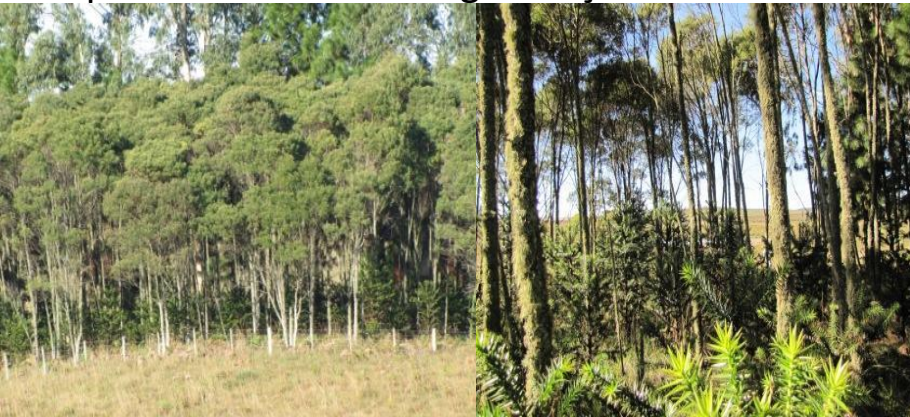
Figura 03- Consórcio de Bracatinga com Araucária, agricultor de região de FOM. Nordeste do RS. Fonte: Rodrigo Cambará Printes, Julho de 2011.

Na FOD os SAF's são a possibilidade de produção mais viável, devido às condições ambientais que propiciam o rápido crescimento e regeneração natural.