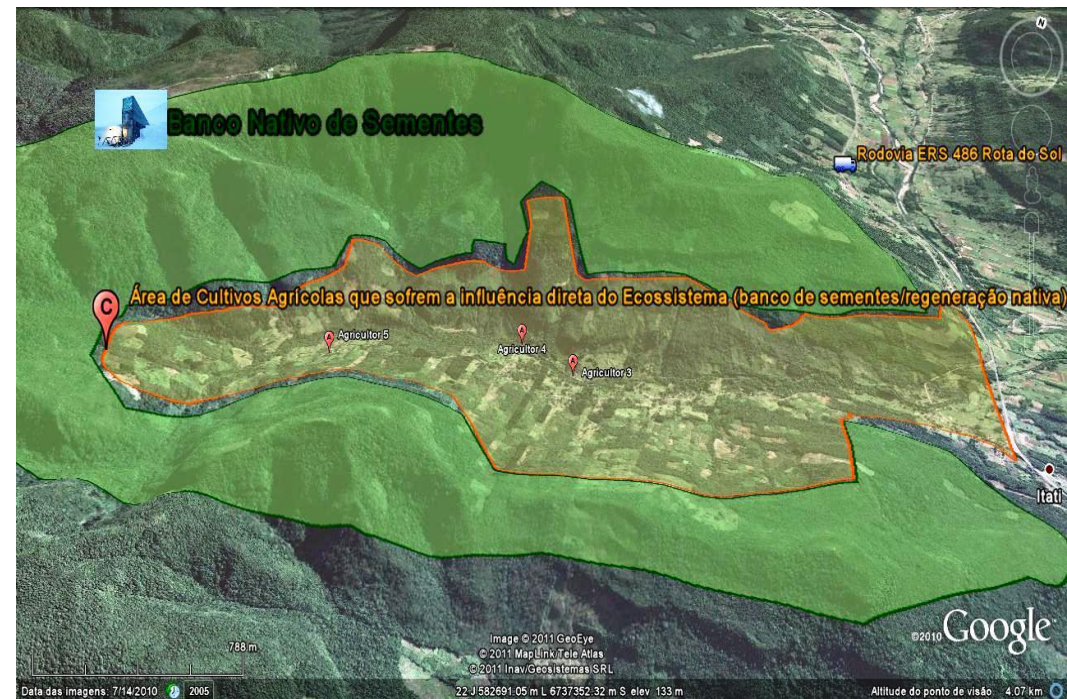
A influência do Banco de Sementes nas partes mais baixas dos fundos de vales. Figura 02: Banco de Sementes, Fonte: Google Earth Processado por Everson Fleck, julho de 2011.

Se identificou que em região de FOD, devido ao clima quente e úmido a dinâmica, naturalmente, força os agricultores a utilizar os SAF's, devido as florestas nativas presentes no entorno formando o banco de sementes (figura 02) e observando as diferenças ilustradas pelas Tabelas 1 e 2.