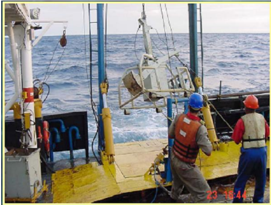
Projeto MAPEM: Monitoramento Ambiental de Perfuração Exploratória Marítima