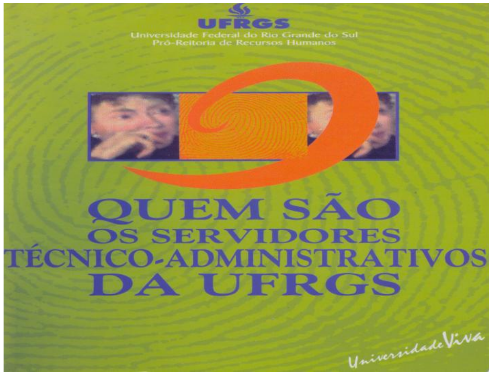
Quem são os Servidores Técnico-Administrativos da UFRGS