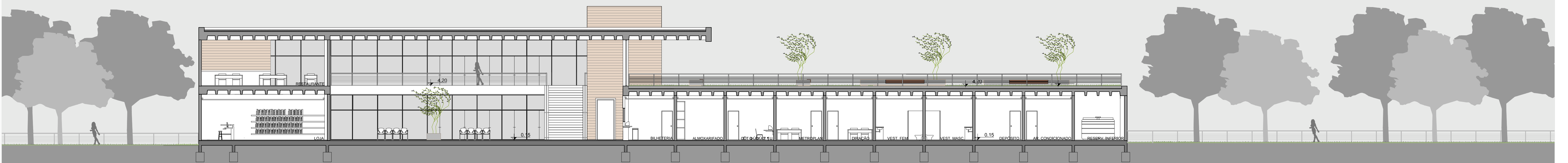
CORTE AA e 1/125