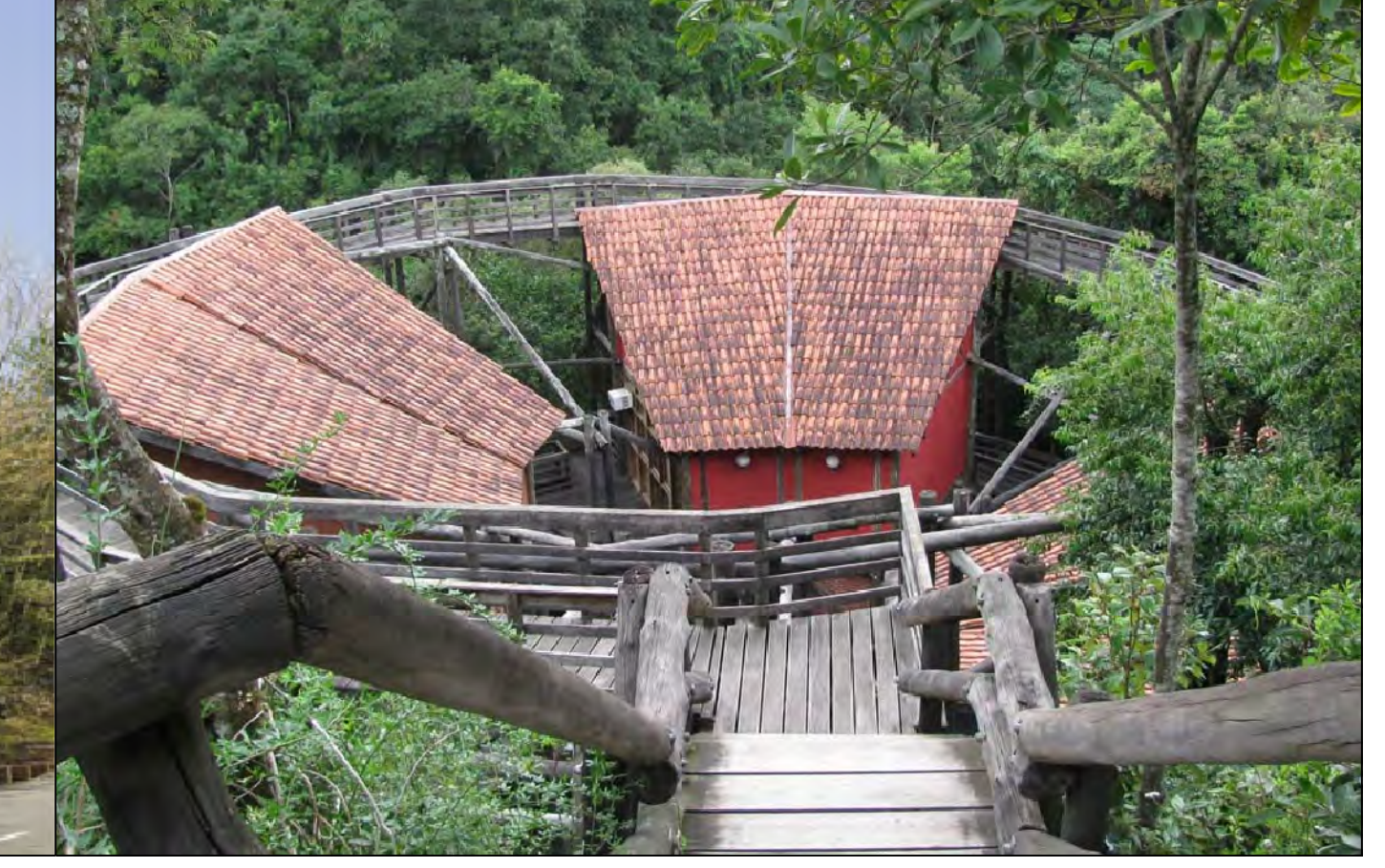
UNLIVRE Local: Curitiba, Brasil Autor: Domingos Bongestabs