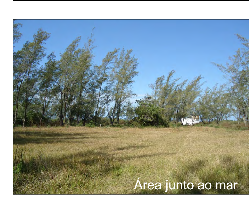
Área junto ao mar