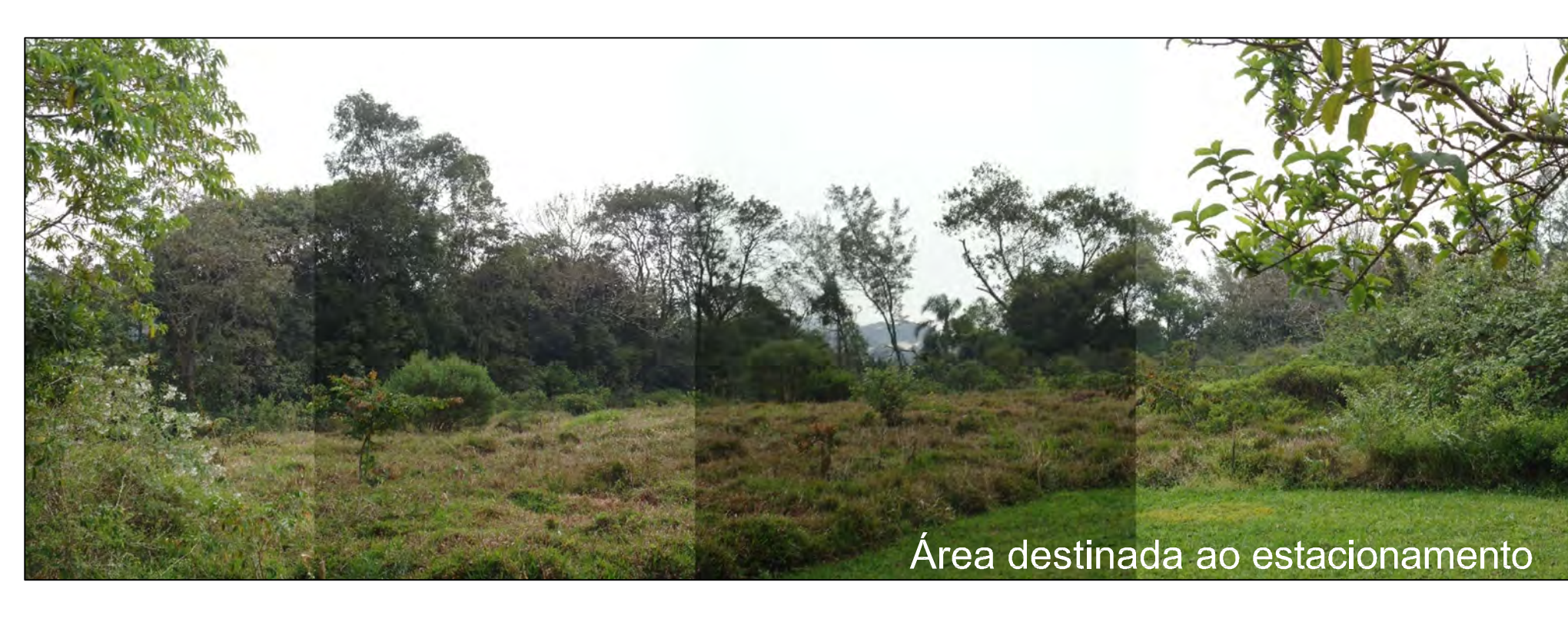
Área destinada ao estacionamento