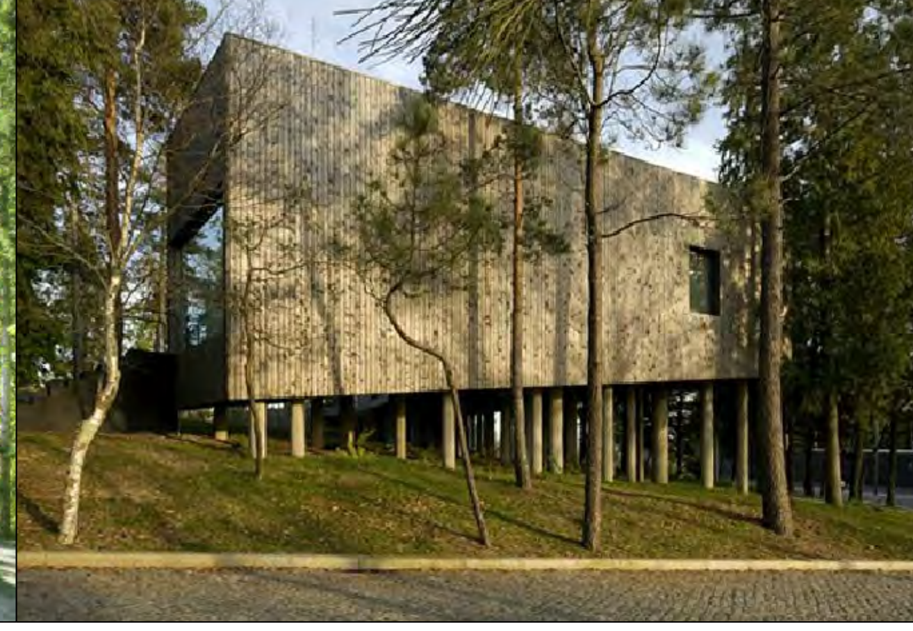
Centro de Interpretação Ambiental Paredes de Coura Local: Portugal Autor: Filipa Guerreiro e Tiago Correia