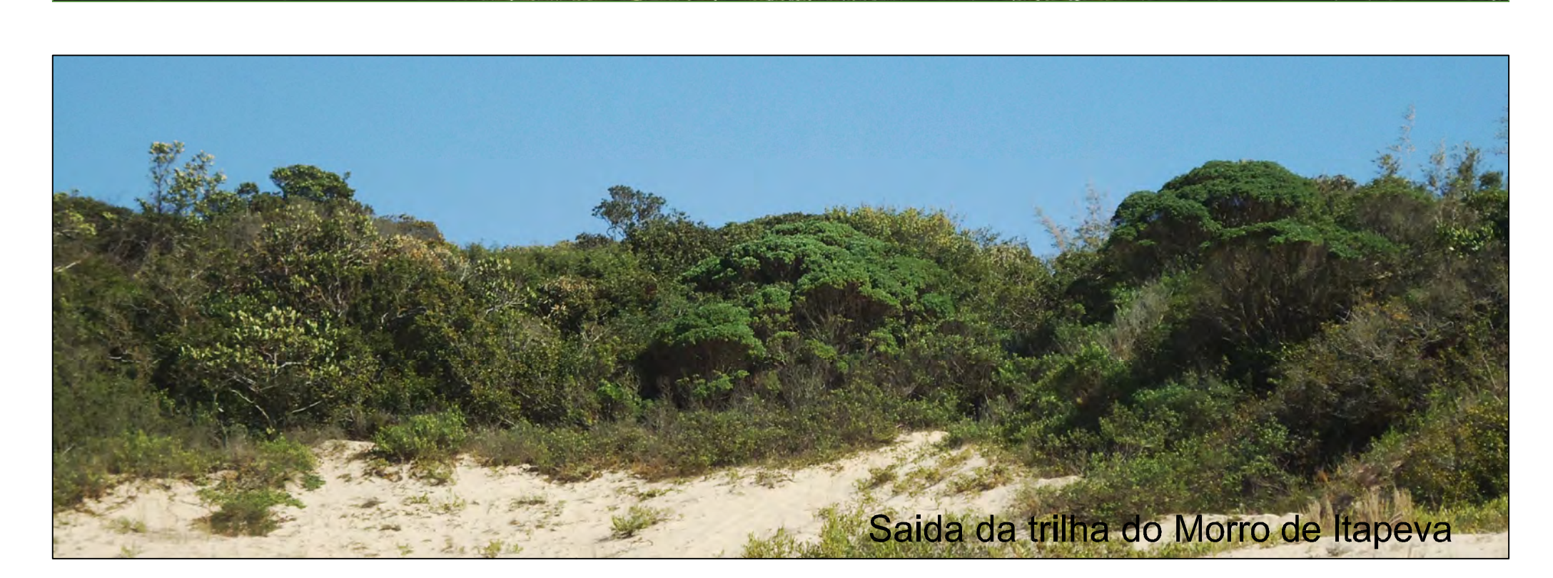
Saída da trilha do Morro de Itapeva