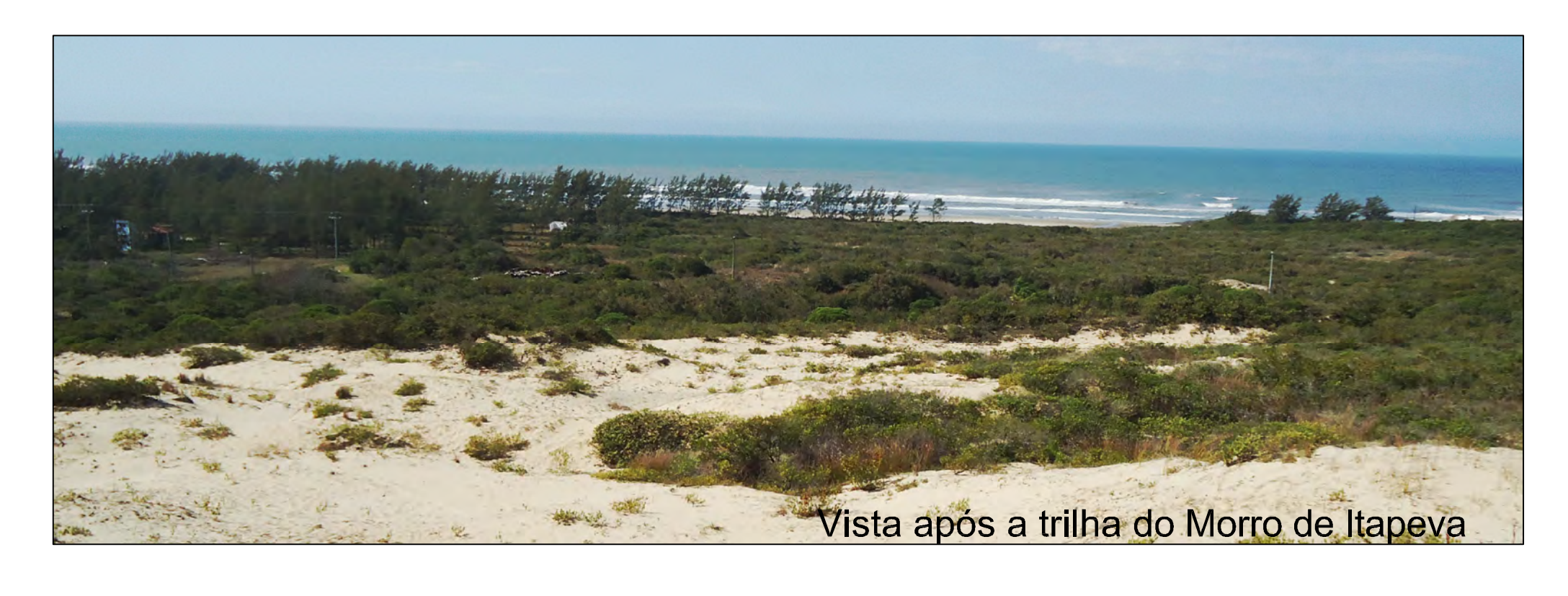
Vista após a trilha do Morro de Itapeva