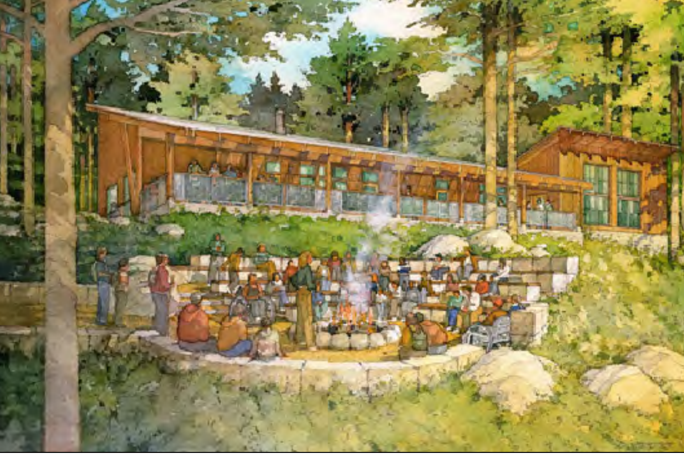
Yosemite Environmental Education Center Local: Yosemite National Park, California, EUA Autor: Siegel and Strain Architects