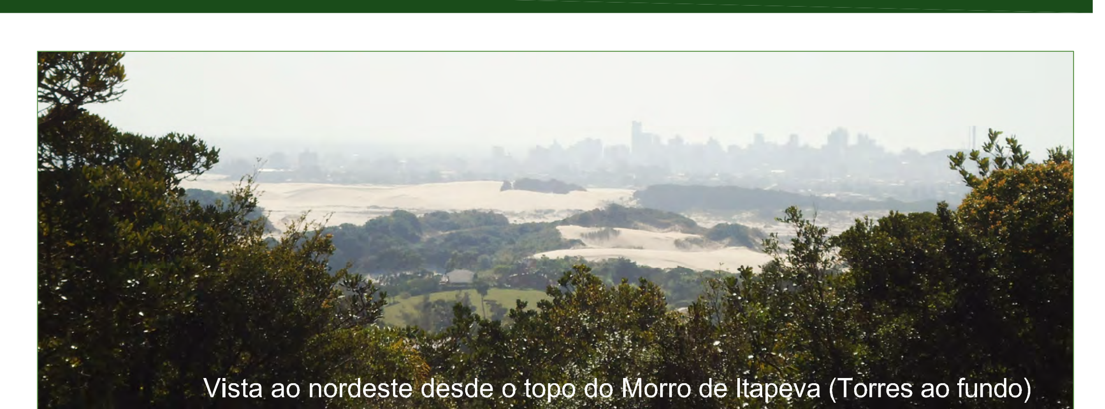
Vista ao nordeste desde o topo do Morro de Itapeva (Torres ao fundo)