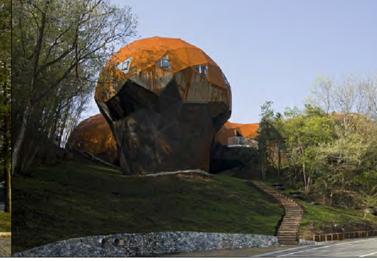
Bubblectecture H Local: Sayo-cho, Hyogo, Japão Autor: Shuhei Endo