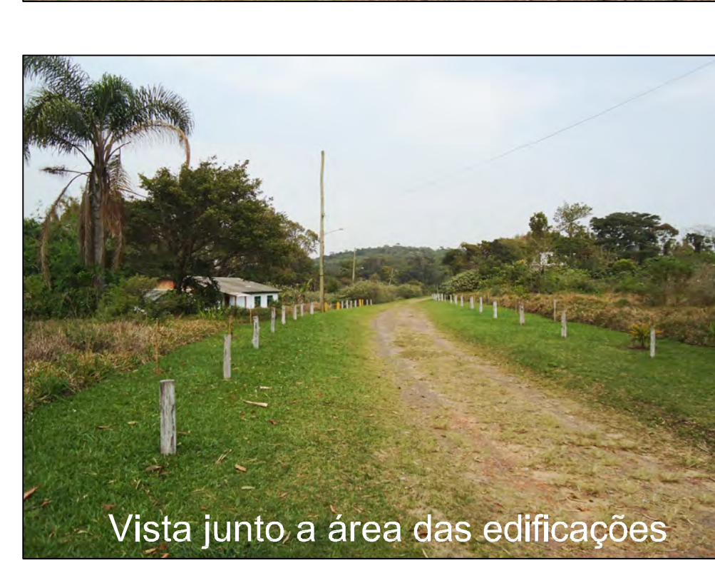
Vista junto a área das edificações