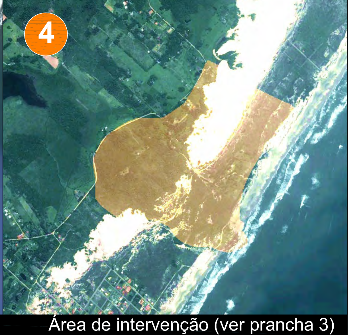
Área de intervenção (ver prancha 3)