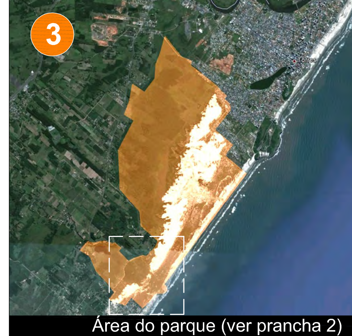
Área do parque (ver prancha 2)