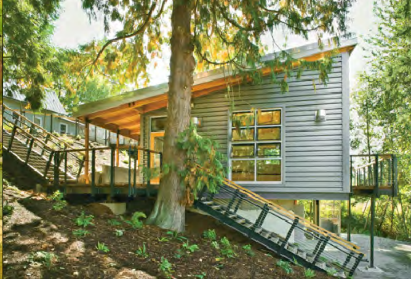
Mercer Slough Environmental Education Center Local: Bellevue, Washington, EUA Autor: Jones & Jones Architects