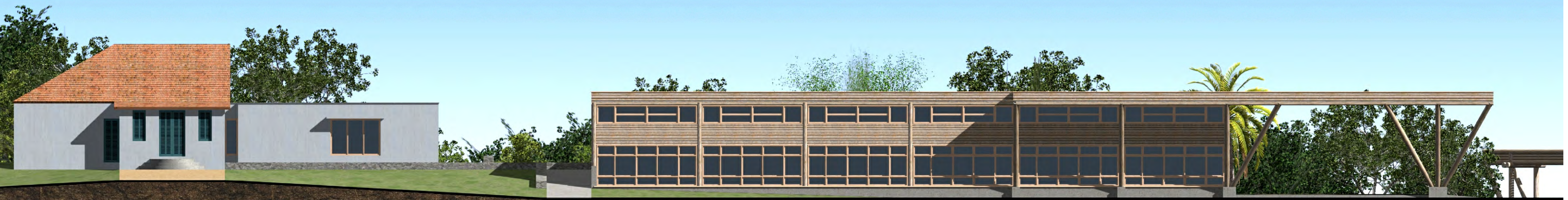
SOL - março, 9 h