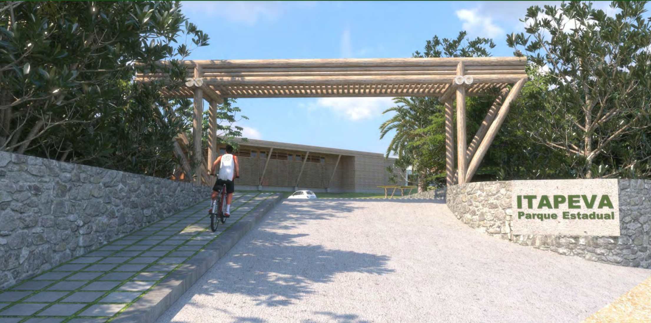
Pórtico de acesso - SOL - março, 10 h