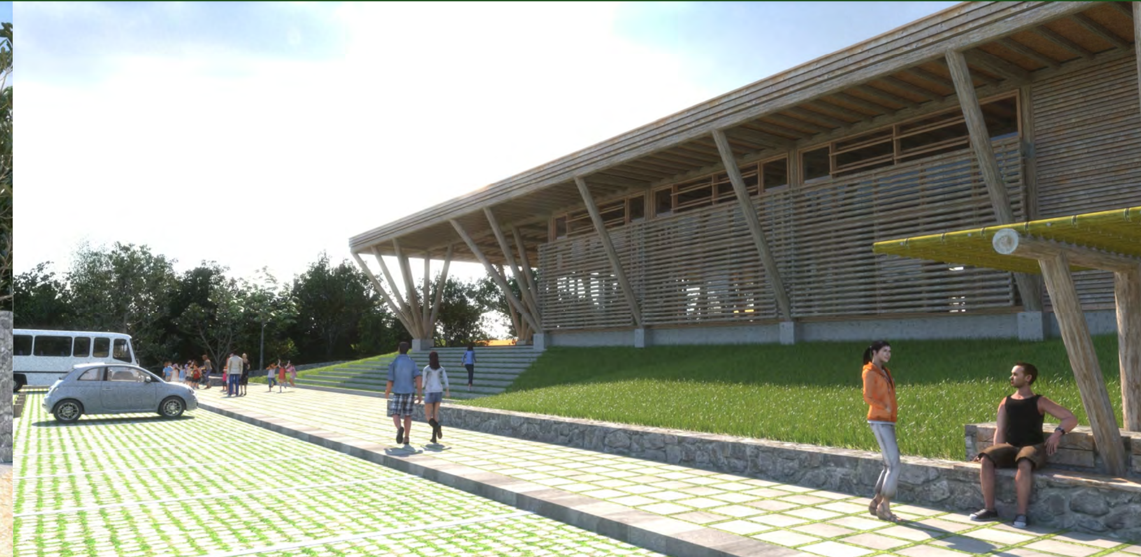
Vista desde o estacionamento - SOL - março, 10 h