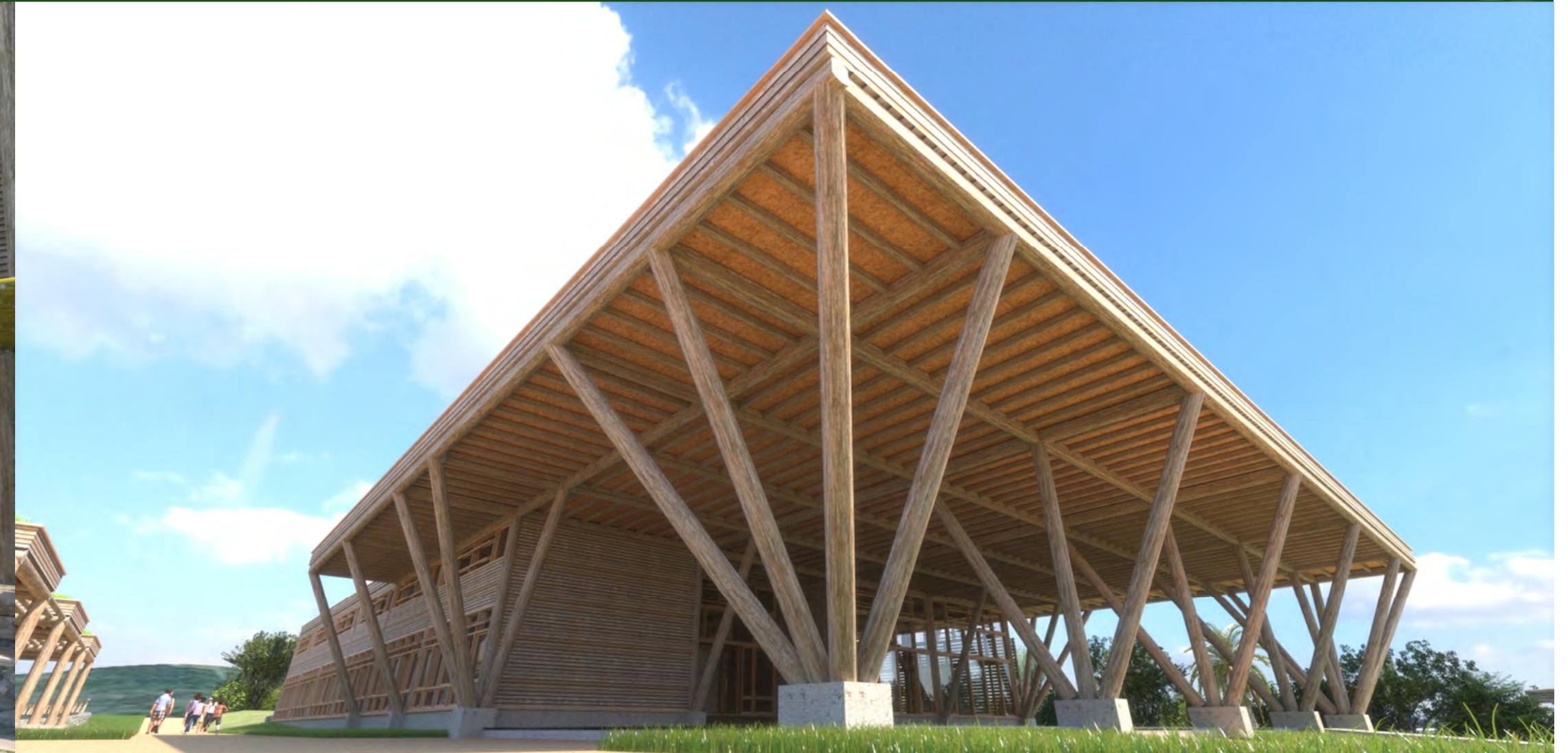
Grande angular da cobertura - SOL - abril, 12 h