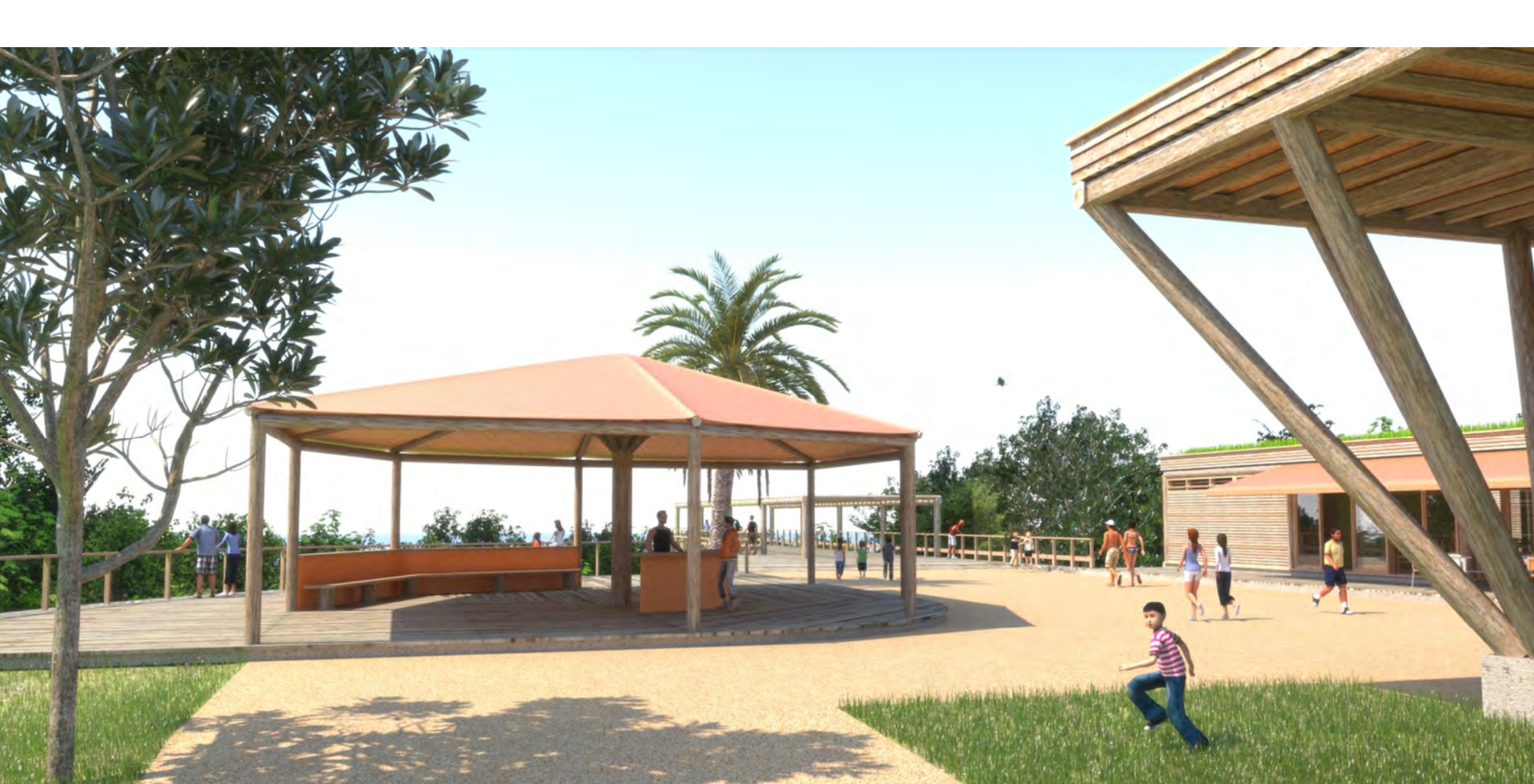
Quiosque de informação - SOL - março, 11 h