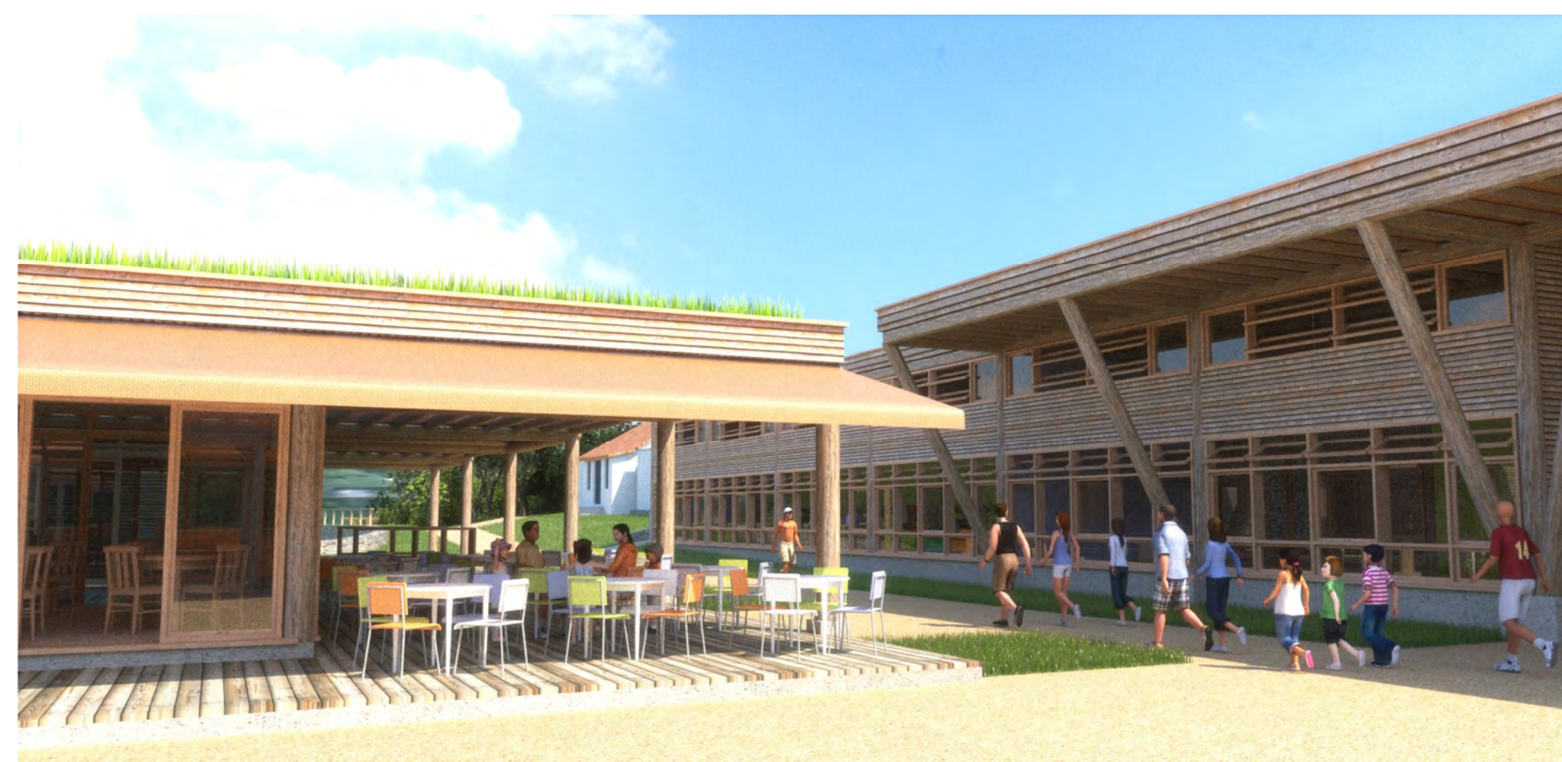
Lancheonete e rua - SOL - abril, 12 h