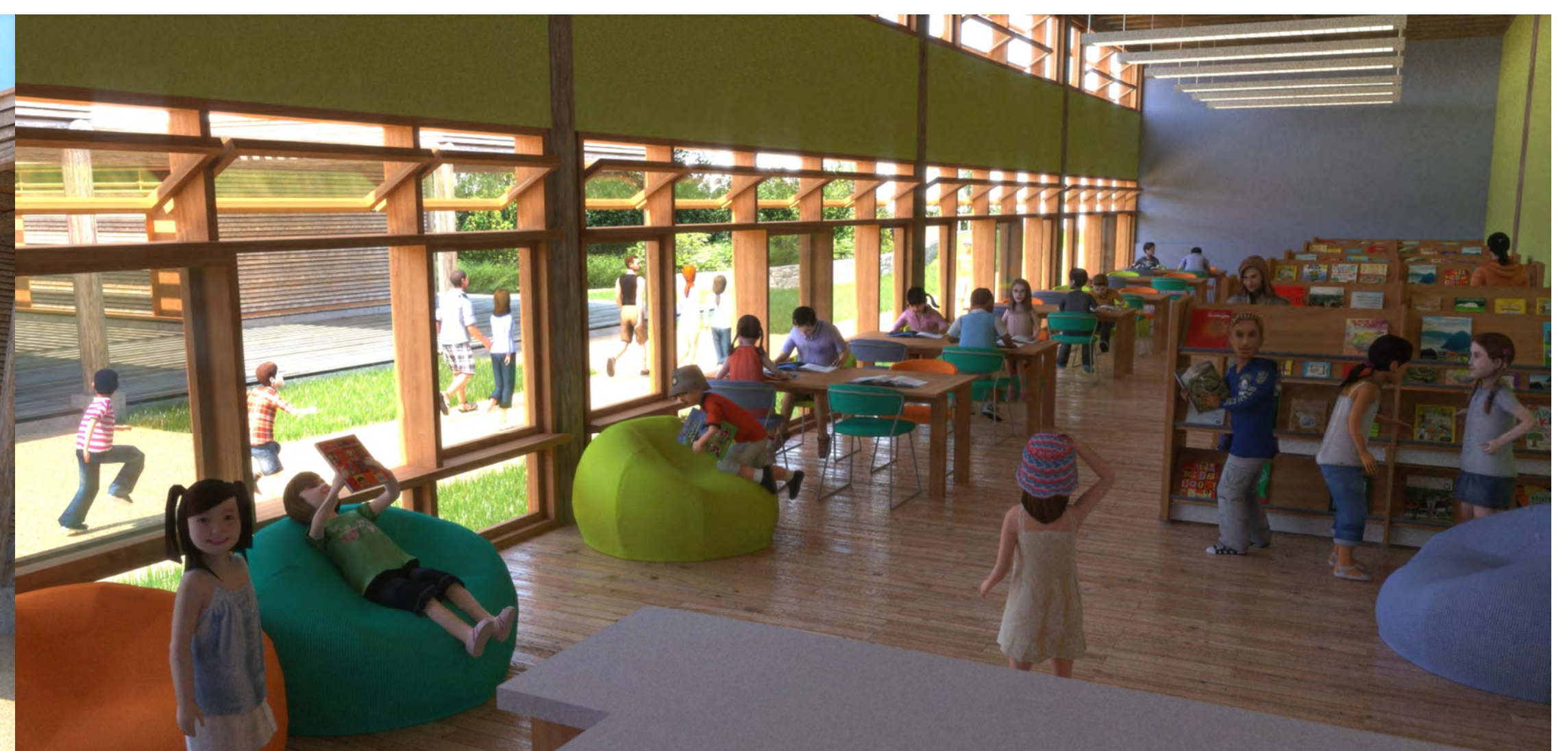
Biblioteca - SOL - março, 11 h