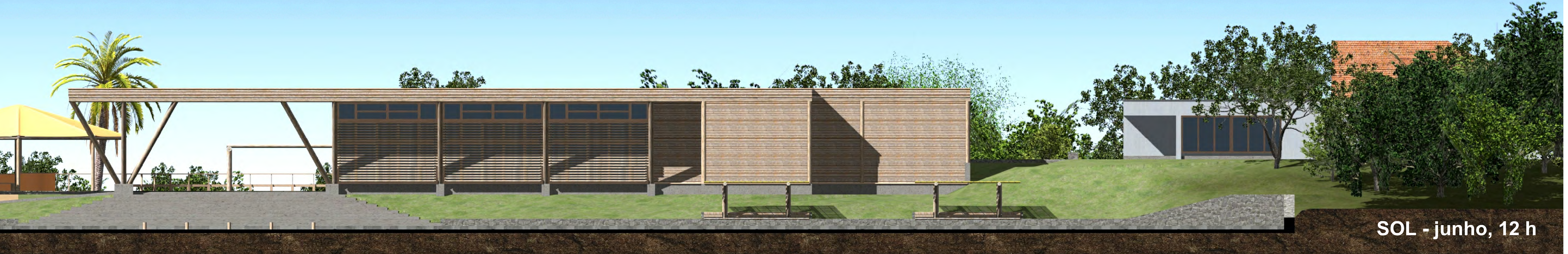
SOL - junho, 12 h