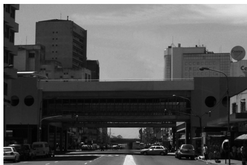
Figura 5 | Vista da Av. Júlio de Castilhos com o CPC – Vista 1.

Nota: N.Bonita N.Feia=Nem Bonita Nem Feia, Muito.M.Bonita=Muito Mais Bonita, M.Bonita=Mais Bonita, N.M.B.N.M.F.=Nem Mais Bonita Nem Mais Feia, Muito M.Feia=Muito Mais Feia. M.O. =Média dos valores Ordinais (teste estatístico não-paramétrico Kruskal-Wallis). Os valores entre parênteses referem-se aos percentuais.