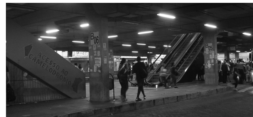
Figura 3 | Acesso às lojas do lado A pelo terminal.