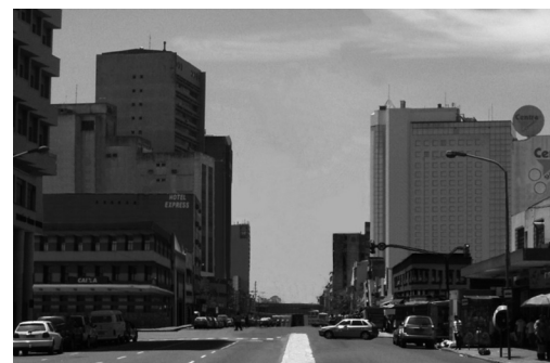
Figura 6 | Vista da Av. Júlio de Castilhos sem o CPC – Vista 2.

no agradável e organizado, significando, possivelmente, uma comparação com o Camelódromo da Praça XV, em que não havia uma clara organização das bancas. Em relação aos usuários, 33,3% (11 entre 31) avaliam positivamente a aparência interna do CPC e 29,1% (9 entre 31) a avaliam negativamente. O principal motivo indicado pelos usuários que avaliam negativamente a aparência interna é a falta de cor (17,4%), mas também foram citados o fato de ser escuro e a aglomeração das bancas. Percebem-se semelhanças nos motivos citados por lojistas e por usuários para avaliar negativamente a aparência interna do CPC, sendo que a ausência de cor é apontada por ambos os grupos de respondentes.