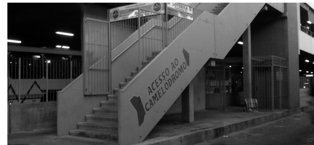
Figura 2 | Acesso externo às lojas do lado A.

Nota: M.S.=Muito Satisfatórias, Sat.=Satisfatórias, N.N.=Nem Satisfatórias Nem Insatisfatórias, Ins.=Insatisfatórias, M.I.=Muito Insatisfatórias, Aum.M.=Aumentaram Muito, Aum.=Aumentaram, N.N.=Nem Aumentaram Nem Diminuíram, Dim.=Diminuíram, Dim.M.=Diminuíram Muito, M.O.=Média dos valores Ordinais (teste estatístico não-paramétrico Kruskal-Wallis). Os valores entre parênteses referem-se aos percentuais.