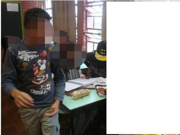
Figura 12 - Alunos interagindo em sala de aula

A turma combinou que realizará venda de lanches no recreio para arrecadar dinheiro para a formatura e o passeio de final de ano. Nesse período ficaram conversando muito entre si sobre o evento, principalmente sobre a decoração. Também comentaram que cada aluno vai poder escolher sua música no dia da formatura. Em suas conversas, pude perceber que eles estão insatisfeitos com as outras turmas de formandos, pois não estão ajudando em nada na organização do evento. (Diário de Campo – 28 de setembro de 2012).