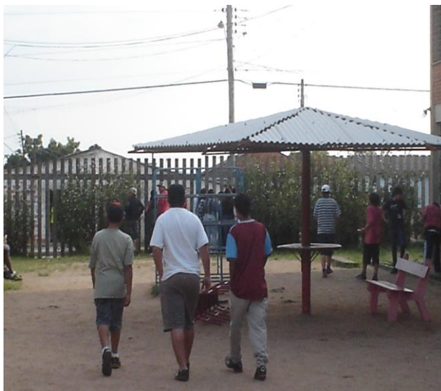
Figura 5 - Na hora do recreio, alunos dirigem-se ao muro pra comprar sacolé

É importante registrar a prática realizada pelos alunos que revela a relação que a escola adquire com o seu entorno. Moradores da comunidade, no horário do recreio, aproximam-se do muro da escola para a venda de “sacolés”, um picolé dentro de um saco plástico. Essa dinâmica ocorre todos os dias ao redor da escola: um aglomerado de alunos aproxima-se do muro e realiza a compra, rapazes e meninas consomem tal alimento. Pode-se também perceber no horário do recreio escolar a presença de jovens, pertencentes ou não a escola, do lado de fora do pátio, procurando uma aproximação e conversa com os alunos, principalmente com as meninas (Diário de Campo – 17 de agosto de 2012).