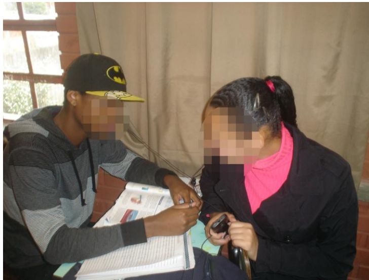
Figura 3 -Compartilhando o fone de ouvido do celular em sala de aula

O grupo formado por alguns alunos da turma pesquisada sentou em um banco (junto ao quiosque da escola, uma área a céu aberto onde tradicionalmente os professores levam os alunos para ter aulas em dias de muito calor), espremendo-se, aliás, para que todos pudessem sentar juntos e inclusive algumas meninas sentaram no colo de outras, abraçando-se e ressaltando que sempre gostavam de sentar naquele local (Diário de Campo – 13 de julho de 2012).