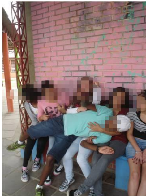
Figura 7 - Brincadeiras da turma – o rapaz se “joga” sobre as garotas

Nesse mesmo dia, ao final do recreio, as garotas de uma turma de C30, ao se dirigirem para a sua sala de aula, entram no prédio e atravessam o corredor dançando um funk (uma menina atrás da outra, esfregando os seus corpos com conotação erótica), com direito à música alta, gritos e muitas gargalhadas por parte delas (Diário de Campo – 17 de agosto de 2012).