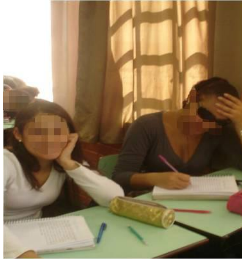
Figura 8 - Assistindo aula com óculos escuros

estilo e que fazem referências à sexualidade (Diário de Campo – 22 de agosto de 2012).