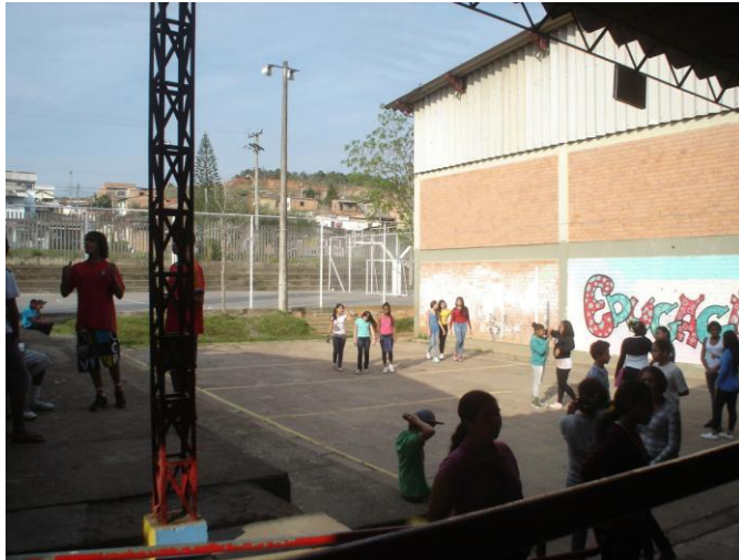
Figura 6 - O recreio acabou - voltando para a aula

Nesse mesmo dia, ao final do recreio, as garotas de uma turma de C30, ao se dirigirem para a sua sala de aula, entram no prédio e atravessam o corredor dançando um funk (uma menina atrás da outra, esfregando os seus corpos com conotação erótica), com direito à música alta, gritos e muitas gargalhadas por parte delas (Diário de Campo – 17 de agosto de 2012).