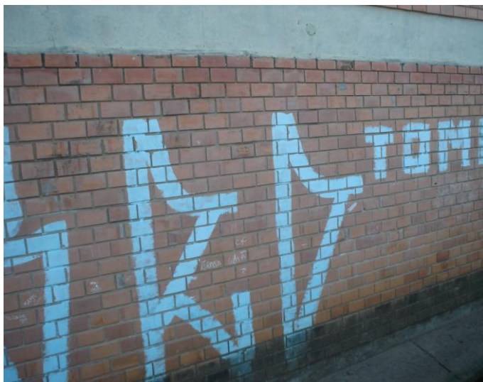
Figura 11 - Pichações na parede da escola

Existem diversas produções na escola que são marcas ou escritas de alunos (ou de outros jovens que entram na escola, inclusive escondidos) com tinta, giz, corretivo, enfim, uma série de materiais que servem para registrar um nome ou apelido, ou os nomes de um casal de namorados ou mesmo o nome de um bonde. Algumas mensagens possuem códigos indecifráveis (pelo menos para mim) (Diário de Campo – 27 de setembro de 2012).