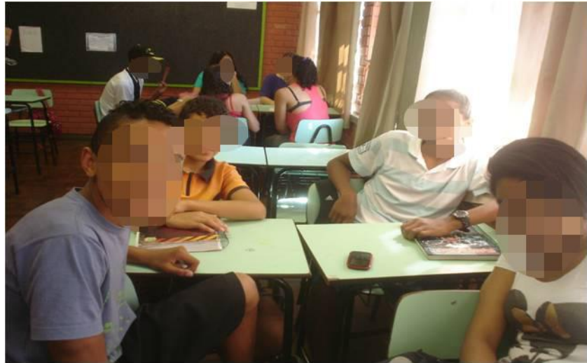
Figura 10 - Diferentes grupos reunidos em sala de aula.

como quem gostou do assunto e disse que costuma sair à noite e entrar em diversas casas noturnas (Diário de Campo – 24 de agosto).