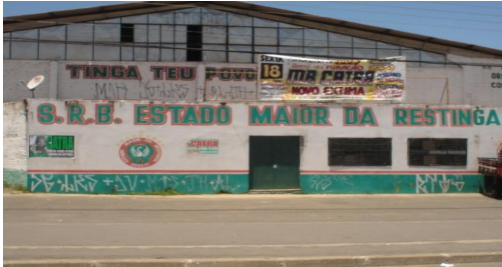
Figura 2 - Quadra da Estado Maior da Restinga 4

ou mesmo de outros centros do país (como é o caso do Rio Janeiro) para a realização de shows.