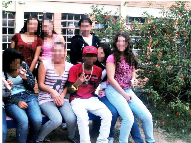
Figura 4 - Turma reunida no recreio 12

celular na mão e utilizam o som alto. Na maioria das vezes, escuta-se o som de funk . É um fato que se repete nos rituais de entrada, saída, intervalos entre os períodos e inclusive durante o andamento das aulas. (Diário de Campo – 15 de agosto de 2012).