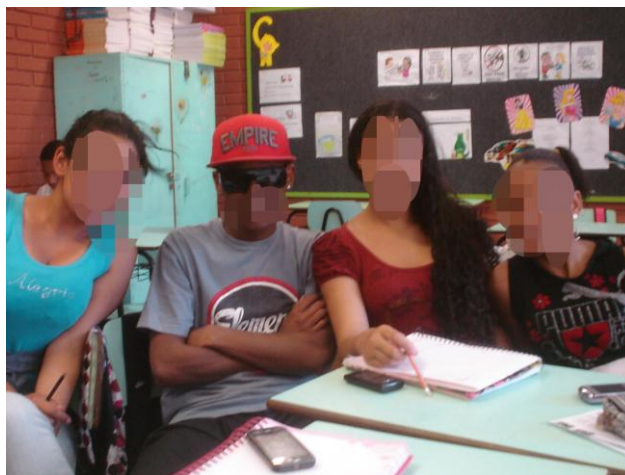
Figura 9 - Turma trabalhando em grupo na aula – óculos escuros novamente