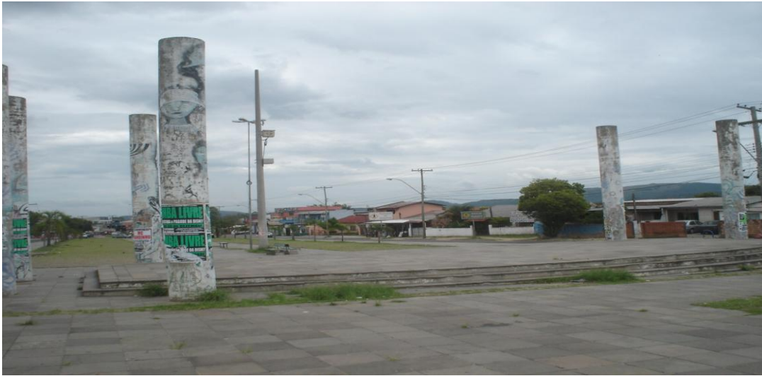
Figura 1 - Esplanada da Restinga, Praça situada entre a Restinga Velha e a Nova 3

Após a contextualização histórica da formação do bairro, é importante também destacar suas características atuais. Toda essa trajetória histórica de exclusões, presente desde as primeiras remoções e na carência de melhores estruturas, possibilitou a ampliação de problemas sociais como a baixa escolaridade, o desemprego, o tráfico de drogas. Tudo isso deixa uma grande parte da população do bairro vulnerável a tais problemas. Estes problemas sociais ganharam uma grande dimensão entre a população atual, não só em função das condições pelas quais passaram os primeiros moradores que lá chegaram, mas também pela precária intervenção do poder público. É importante sempre referir que se ao longo de sua história a população da Restinga conseguiu melhorias para o bairro foi graças aos seus esforços e às suas lutas. De qualquer forma, ainda pode-se notar uma carência estrutural e social muito intensa na região.