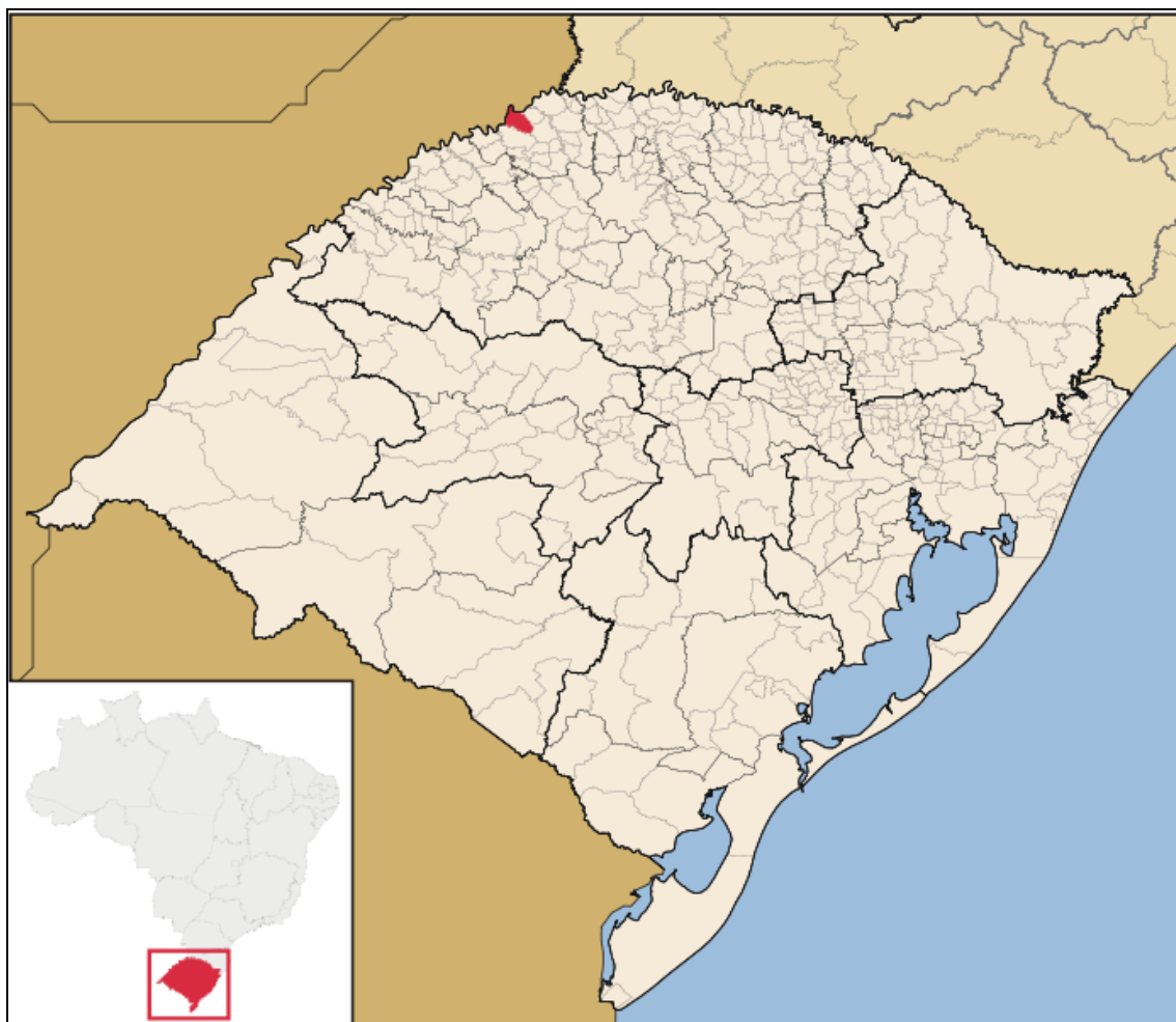
Figura 1: Mapa do Rio Grande do Sul, com destaque o município de Tiradentes do Sul.