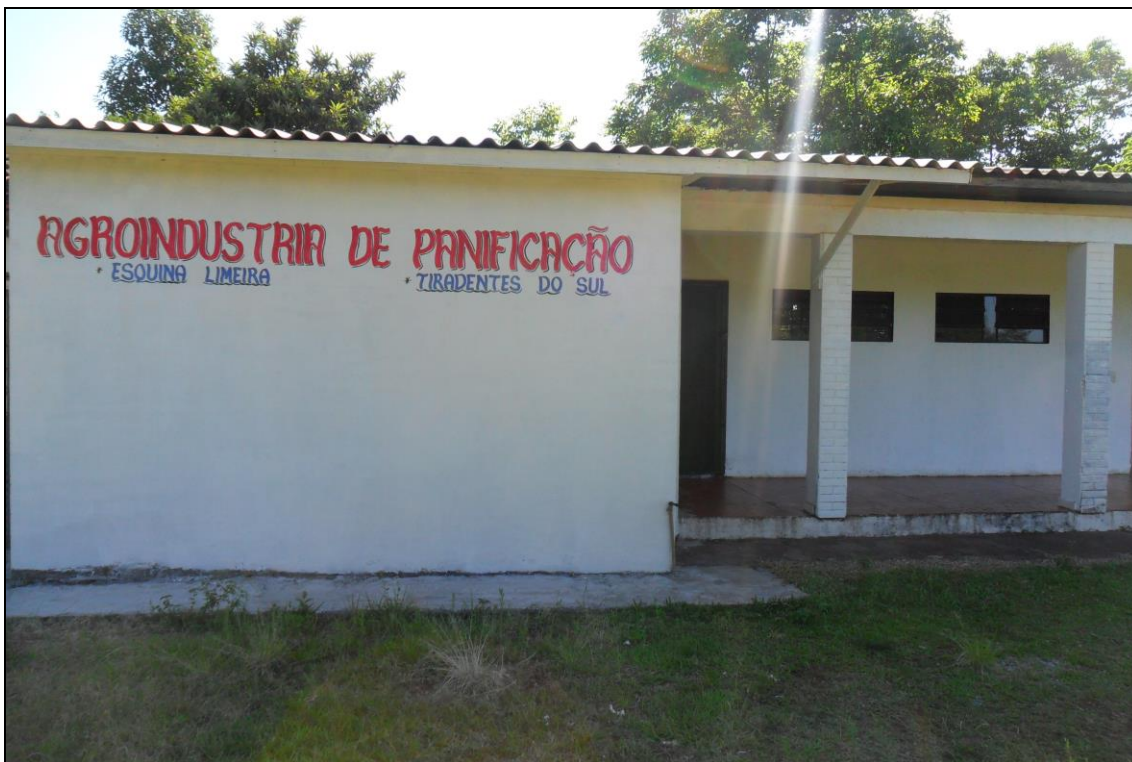
Figura 2: Imagem da frente da Agroindústria de Panificação da Esquina Limeira

mesma estava adequada à legislação sanitária, obtendo assim o seu alvará sanitário no dia 19 de outubro de 2011, onde foi considerada apta, desde essa data, a comercializar seus produtos de panificação para todo o Estado do Rio Grande do Sul. Na figura 2, pode ser vista uma imagem da frente da Agroindústria de Panificação da Esquina Limeira.