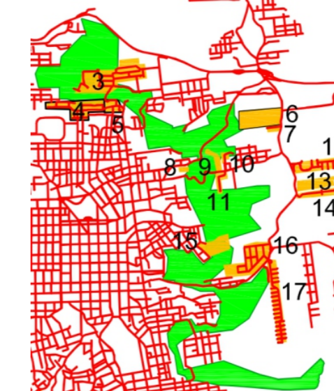
Fig. 1. Placa afixada em Condomínio Moradas - SCS Fig. 2. Ampliação da região do «Cinturão Verde»