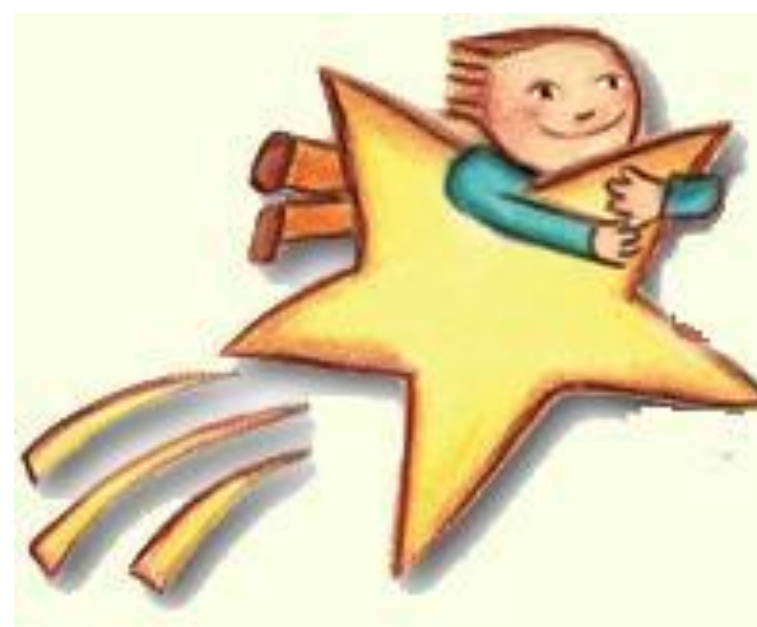
Logo da ferramenta Etoys.

Na segunda atividade o grupo que havia realizado o exercício com o auxílio do laptop , respondeu questões sobre o mesmo assunto, sem utilização de mídias. Para realizar corretamente a atividade os alunos teriam de ter conceitos biológicos esclarecidos que seriam: genótipo e fenótipo, polialelia, sistema ABO e anticorpo e antígeno. Para avaliar o desempenho dos mesmos sujeitos no desenvolvimento do trabalho, com ou sem o auxílio do UCA, comparou-se os resultados dos acertos obtidos por eles nas atividades 1 e 2, sendo que nesta os alunos acertaram em média 45% do que foi solicitado.