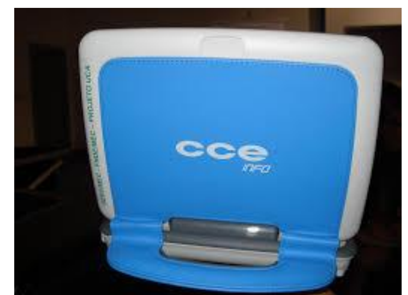
Laptop do projeto UCA.