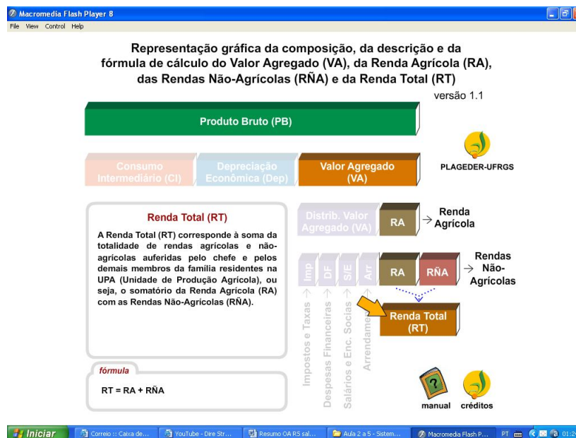
Figura 2 – Representação gráfica de indicadores de avaliação agroeconômica de unidades de produção agrícolas, destacando dois momentos: Produto Bruto e Renda Total – NEAD/IEPE/FCE