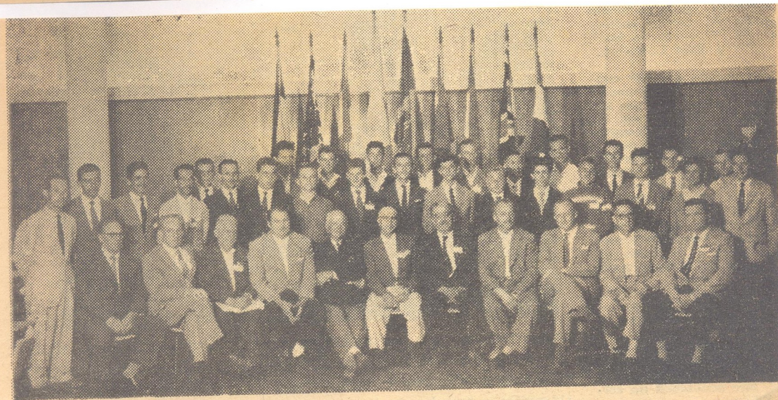
CURSO DE TIMONEIROS DA FARGS — Na foto, aparecem de pé, os alunos do Curso de Timoneiros Oficiais da FARGS, organizado pela atual diretoria e, sentados os diretores e lentes dessa vitoriosa promoção da atual diretoria da veterana entidade