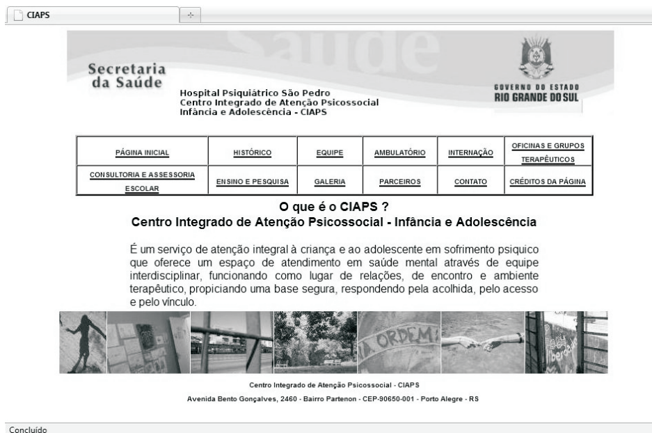
Figura 2: Página inicial do Site do CIAPS

O Hospital Psiquiátrico São Pedro (HPSP) possui uma página institucional hospedada dentro do website da Secretaria Estadual de Saúde do Rio Grande do Sul (SES). A coordenação do CIAPS, então, iniciou contatos com a SES a fim de utilizar esse espaço. Participamos de uma reunião com o responsável pelo site do HPSP, que informou que a página do CIAPS não poderia ser publicada tal como havia sido produzida, já que o site da SES possuía uma pré-configuração de alguns elementos. Acertou-se, assim, que a página seria publicada seguindo o formato padrão, mas com conteúdo produzido pela equipe.